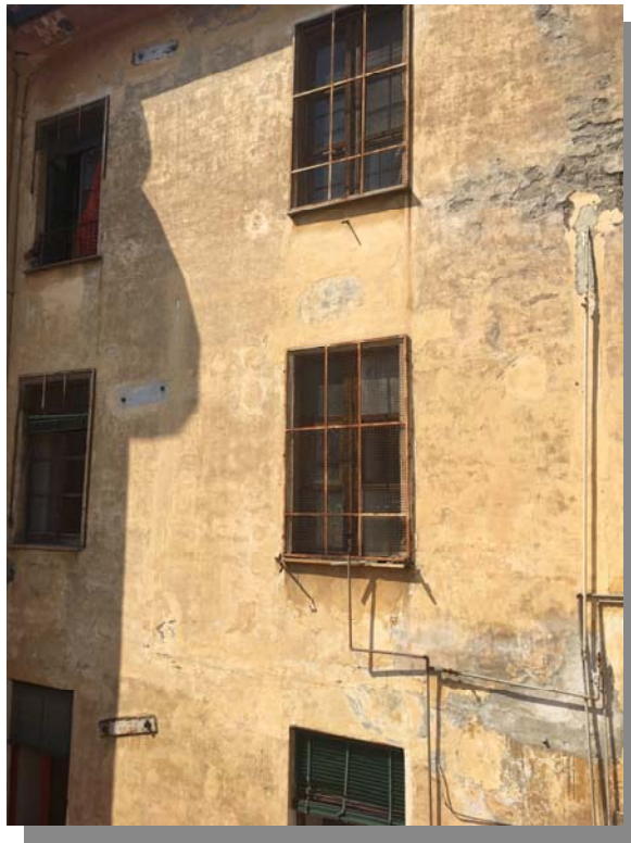
Facciata prospiciente AdE