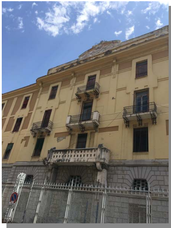
Facciata ex Comune di Castellammare di Stabia lato Sud