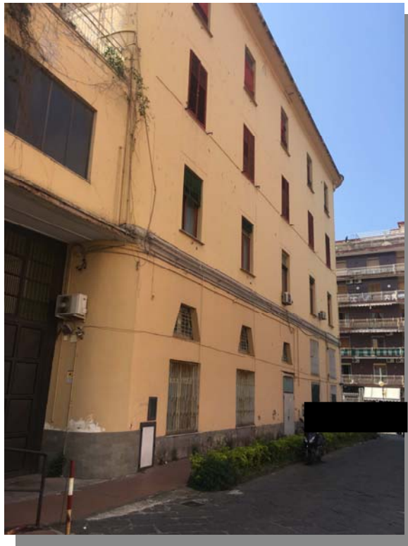
Facciata ex Comune di Castellammare di Stabia lato Ovest ( Acceso Agenzia delle Entrate)