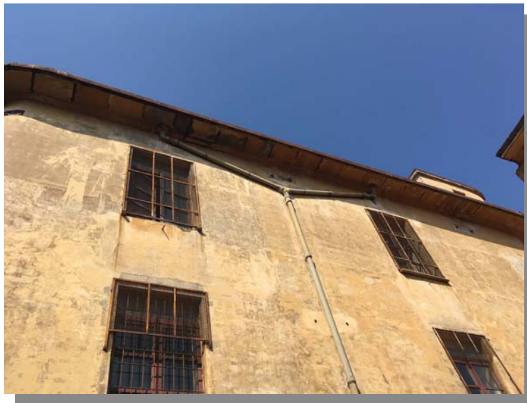
Facciata ex Comune di Castellammare di Stabia lato Nord