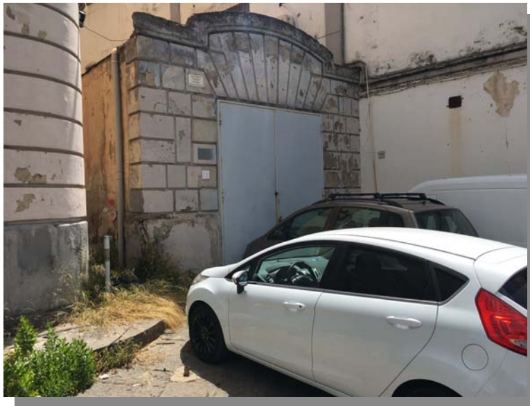
aree antistanti il fabbricato ex Comune di Castellammare di Stabia