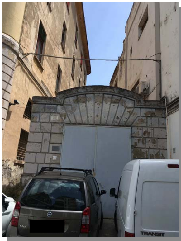
aree antistanti il fabbricato ex Comune di Castellammare di Stabia