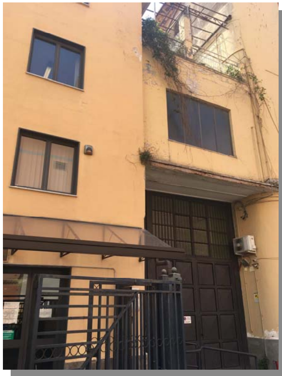
Lato accesso Trafil Sud