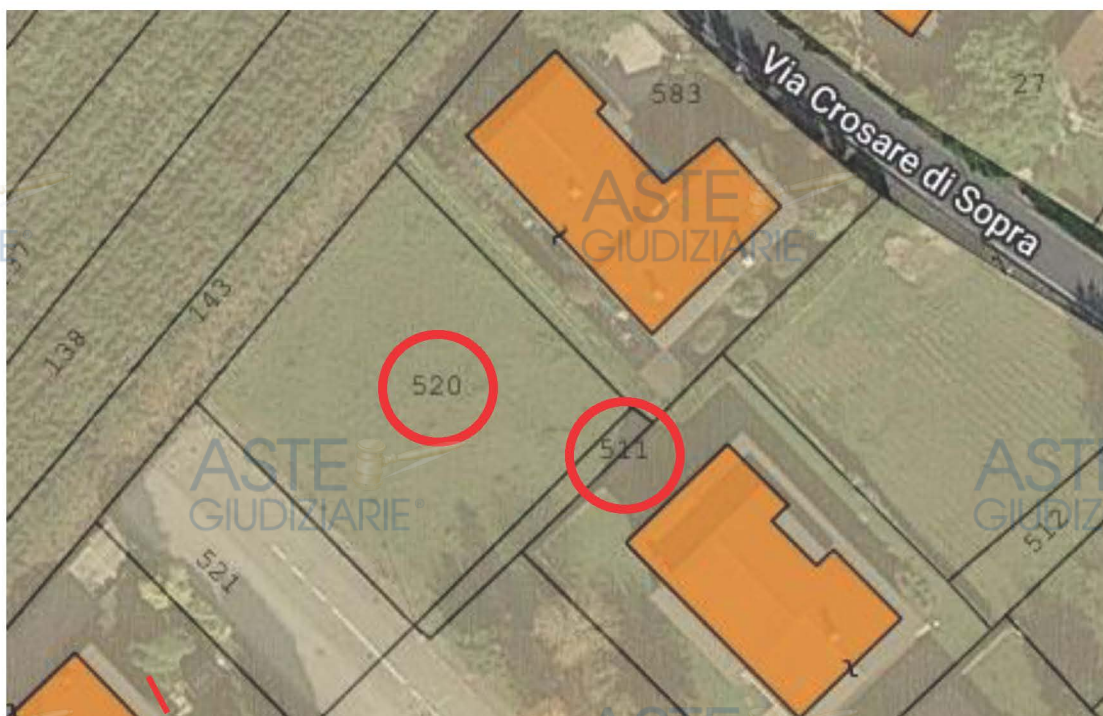
Figura 3 e 3: in rosso il lotto in esecuzione al Fg- 21 mappali 520 e 511 per mq. 820