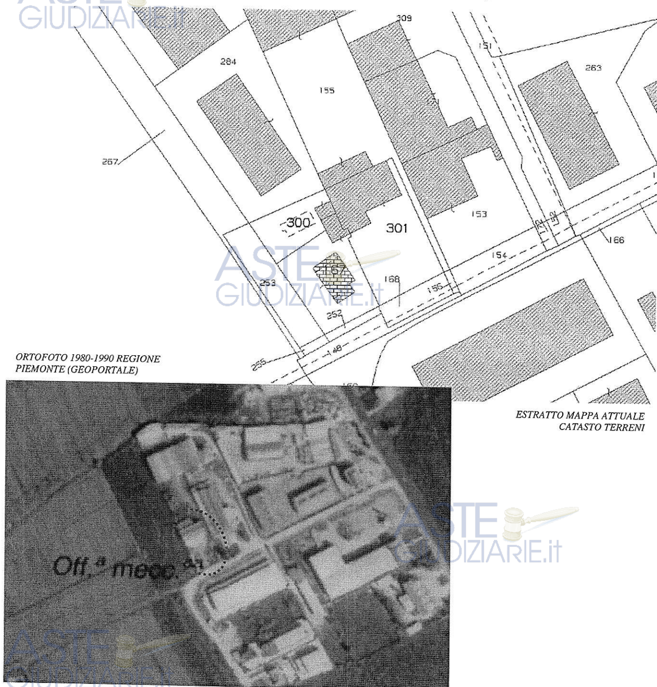
ORTOFOTO 1980-1990 REGIONE PIEMONTE (GEOPORTALE)

Al fine di “accertare se sulla strada [...] siano state costituite servitù” , si è valutato di considerare l'estratto di mappa attuale del Catasto Terreni, l'ortofoto 1980-1990 Regione Piemonte, le visure storiche dell'immobile 6 oggetto di esecuzione, id catastale foglio 8 particella 301, e dell'immobile confinante comproprietario della strada, id catastale foglio 8 particella 155, e l'atto di compravendita Rep. n. 43033 del 09.01.1975 (trascritto a Vercelli il 17.01.1975 ai nn.468/318).