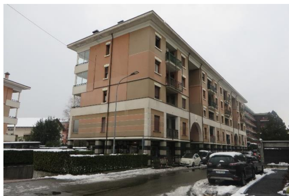
Palazzo 1 (scala A e B)