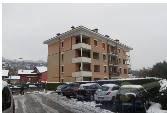
Palazzo 2 (scala C)