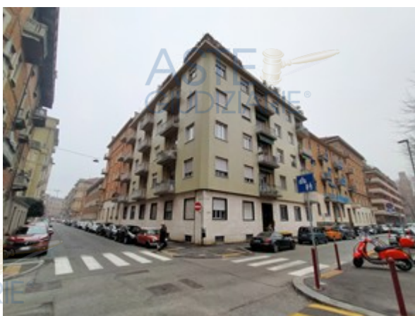
Immobile visto dall'esterno

L'intero edificio sviluppa 7 piani, 6 piani fuori terra (di cui uno arretrato), 1 piano seminterrato. Immobile costruito circa nel 1957