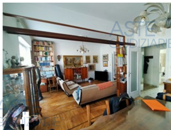
Ampio salone su via ottenuto dall'unione di due camere