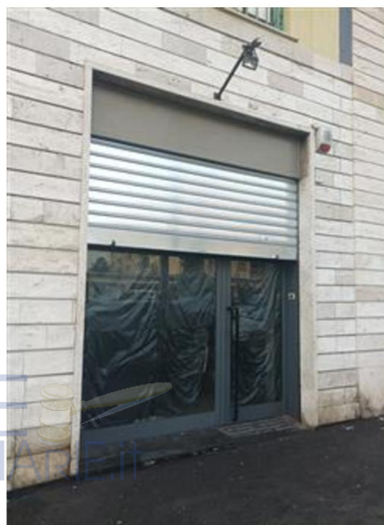
Accesso su Via Sempione