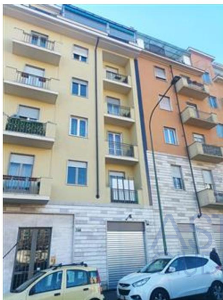
Facciata immobile lato Via Sempione

L'intero edificio sviluppa 7 piani, 6 piani fuori terra, 1 piano interrato. Immobile costruito nel 1957 ristrutturato nel 2012.