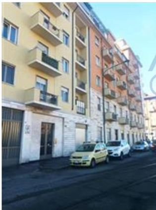
Facciata su Via Sempione

I beni sono ubicati in zona periferica in un'area mista residenziale/commerciale, le zone limitrofe si trovano in un'area mista residenziale/commerciale. Il traffico nella zona è scorrevole, i parcheggi sono sufficienti. Sono inoltre presenti i servizi di urbanizzazione primaria e secondaria.