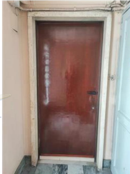
Portoncino accesso da vano scala Condominiale