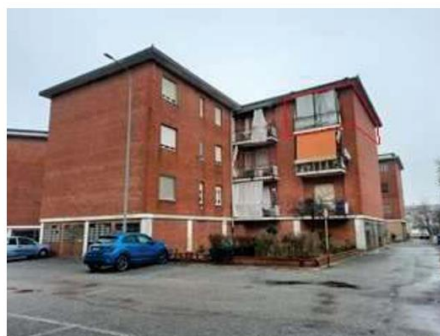
Affaccio immobile a nord-est