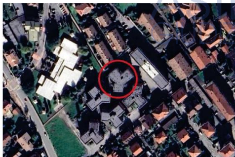
Immagine satellitare

I bene è ubicato in zona semiperiferica di Caselle Torinese, zona ben servita comoda ai mezzi pubblici.