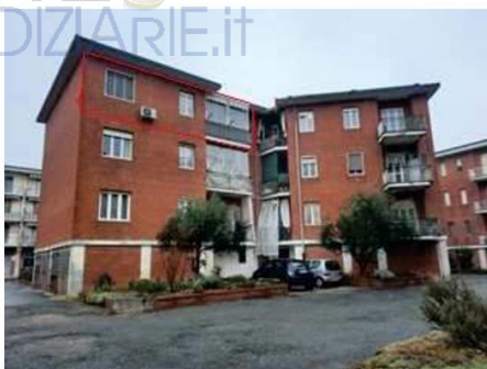
Affaccio immobile a sud-ovest