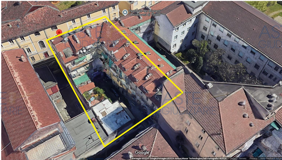
Toponomastica di zona 3D

Il condominio e le relative parti comuni, presentano sinteticamente le seguenti caratteristiche (Foto 1÷8), tipiche delle vecchie costruzioni risalenti ai primi decenni del secolo scorso: