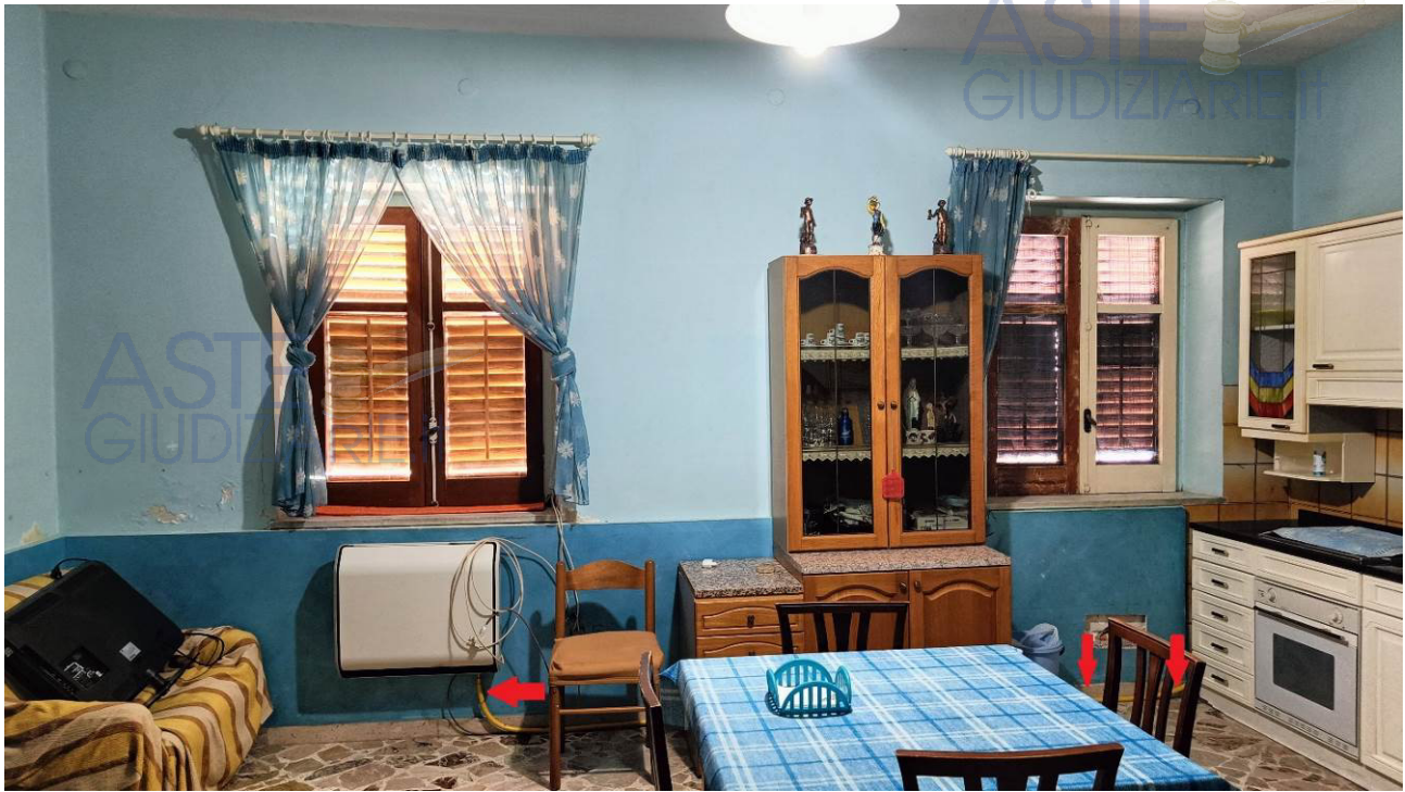
Tubazione gas proveniente dal magazzino Sub 2

È presente una servitù attiva nei confronti dell'adiacente garage (p.lla 143 sub 2) per il passaggio della tubazione gas di alimentazione del termoconvettore.