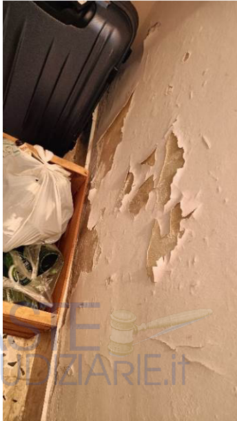
Umidità di risalita disimpegno sottoscala