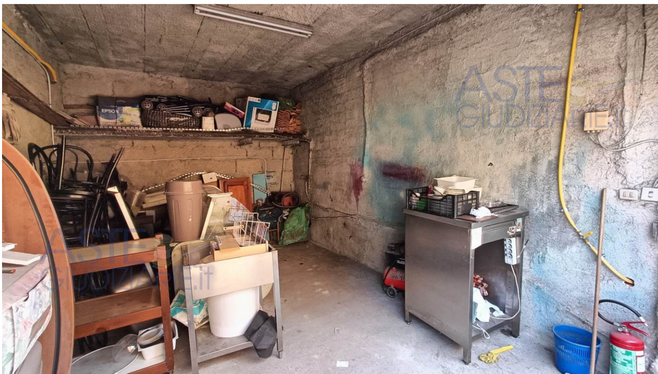
Magazzino al grezzo