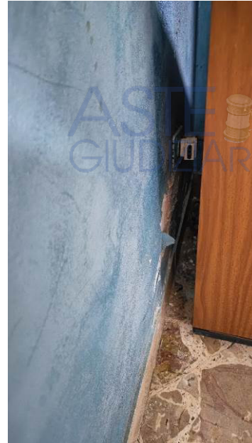
Probabile perdita dal bidet nella parete w.c. lato soggiorno