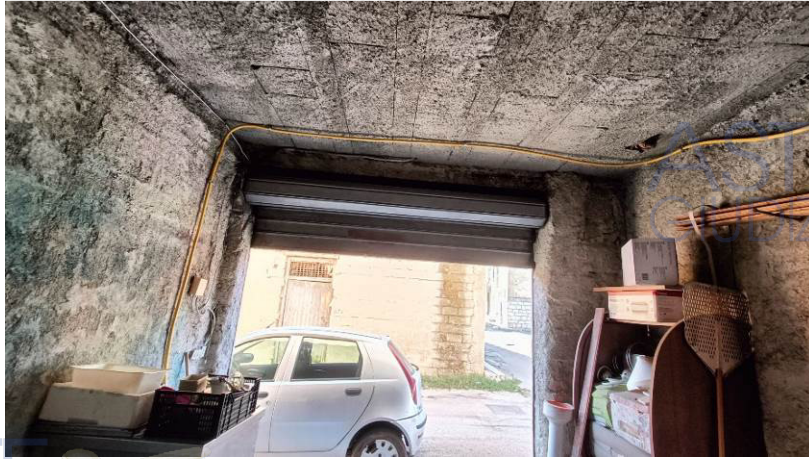
Tubazione gas proveniente dall'esterno e verso l'appartamento sub 1