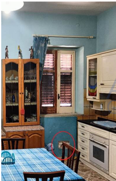
Rottura tubazione di scarico