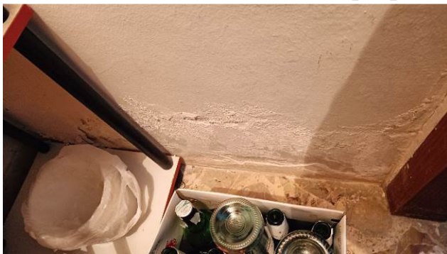
Umidità di risalita Ripostiglio

Spesa stimata per i ripristini: € 1.500,00