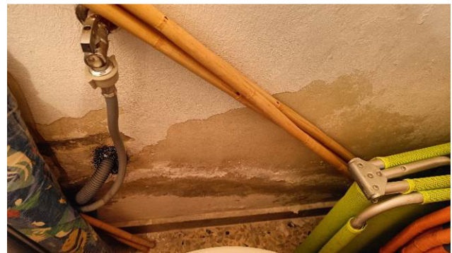
Umidità di risalita sottoscala