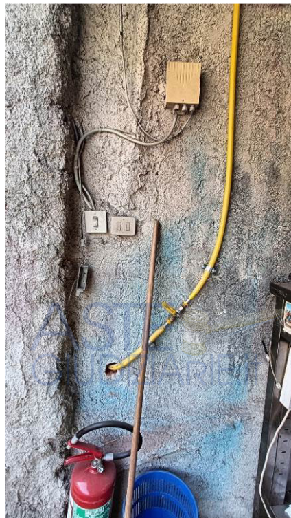
Tubazione gas proveniente dall'esterno e verso l'appartamento sub 1