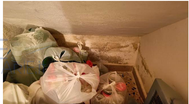
Umidità di risalita sottoscala