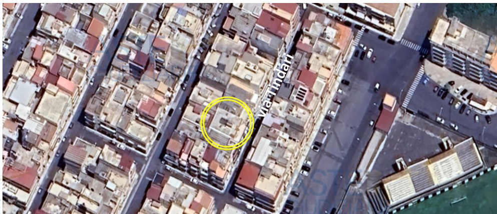
Inquadramento territoriale dell'area in cui si trova il bene pignorato

Il sistema tecnologico dell'appartamento è il seguente: