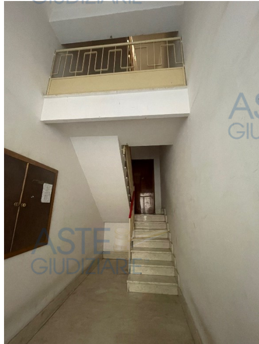
Ingresso all'edificio condominiale