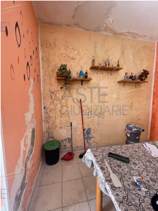
Degrado fisico-materico delle pareti della cucina e del solaio del bagno