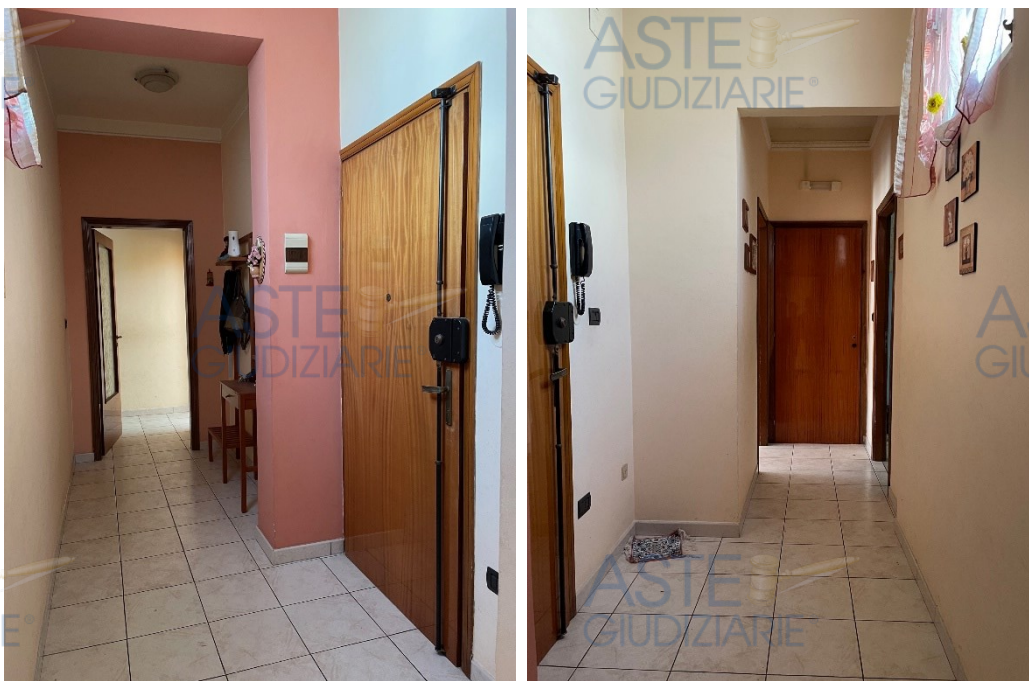
Ingresso e corridoio