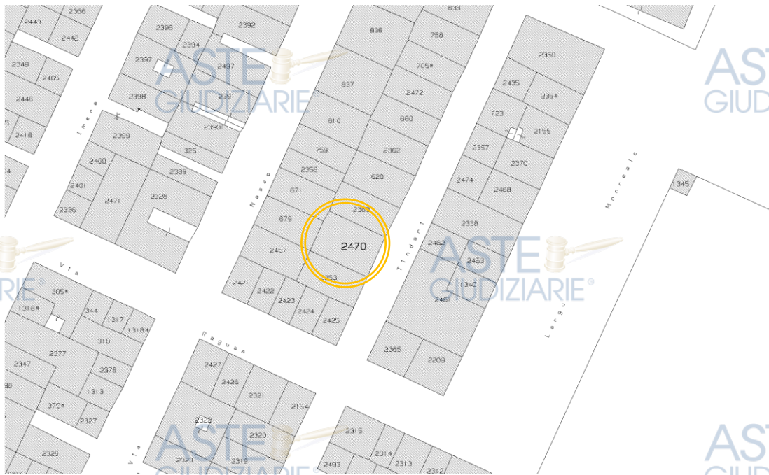
Stralcio del foglio di mappa catastale n. 67

Per l'immediata visualizzazione planimetrica del luogo, è stato di seguito riprodotto lo stralcio del foglio di mappa catastale n. 67, rilasciato dall'Agenzia delle Entrate Direzione Provinciale di Siracusa Ufficio Provinciale – Territorio – che, correlato a due aerofotogrammetrie, rende possibile la percezione della posizione del bene all'interno della città: in particolare l'area, in cui è l'immobile pignorato, è stata indicata con doppio cerchio giallo.