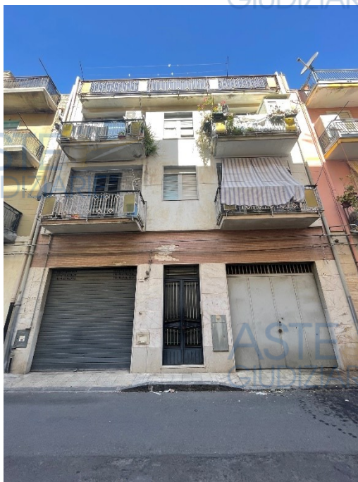
Prospetto dell'edificio in cui si trova l'appartamento pignorato al piano terzo