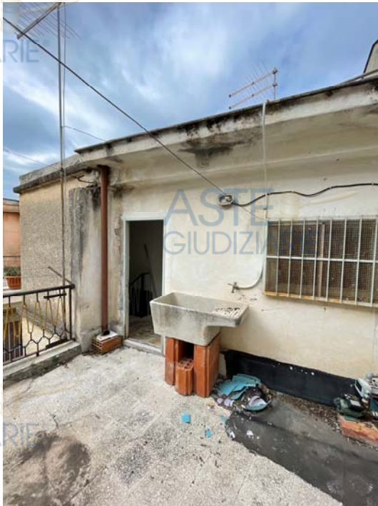
Vista della terrazza