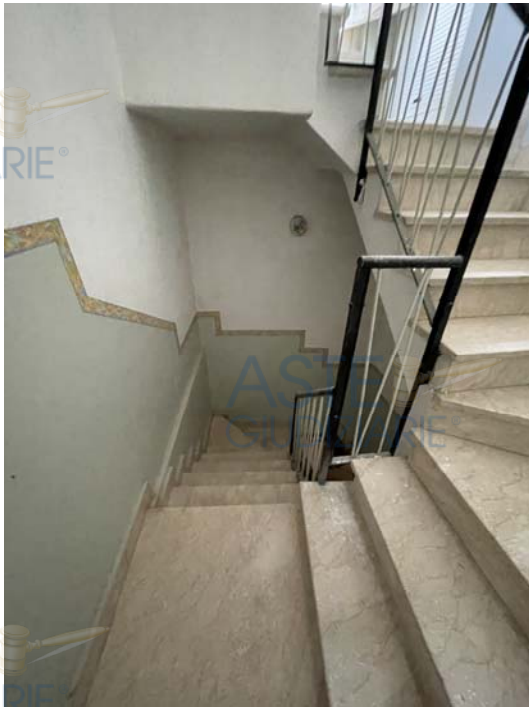
Vista della scala interna