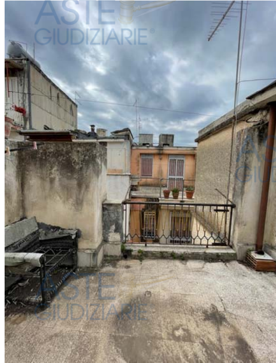
Vista della terrazza