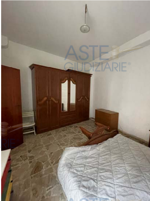
Vista della Camera da Letto