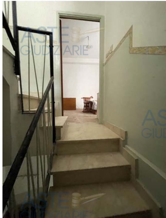
Vista della scala interna