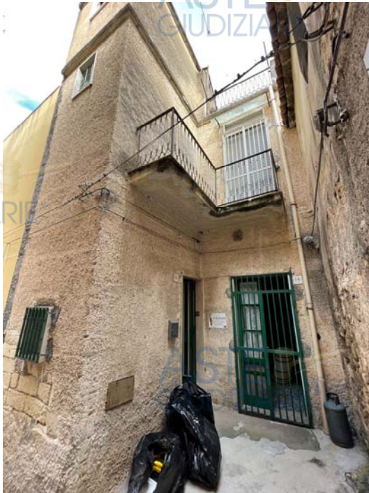
Vista esterna su Via Margellina

Di seguito un dettagliato rilievo fotografico descrittivo di quanto sopra descritto: