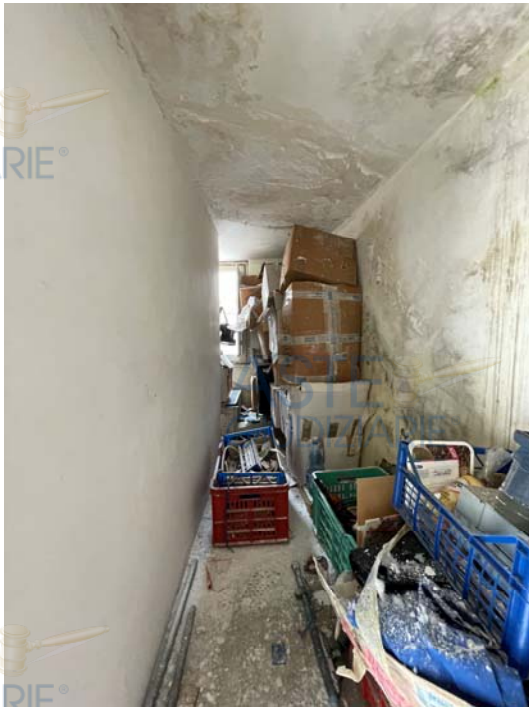
Vista dello spazio annesso alla scala all'ultimo livello