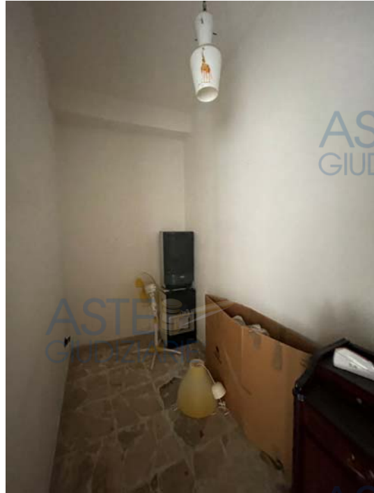
Vista dello Spogliatoio