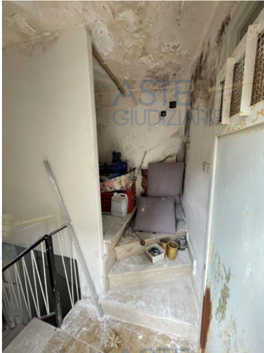
Vista del Disimpegno all'ultimo livello |