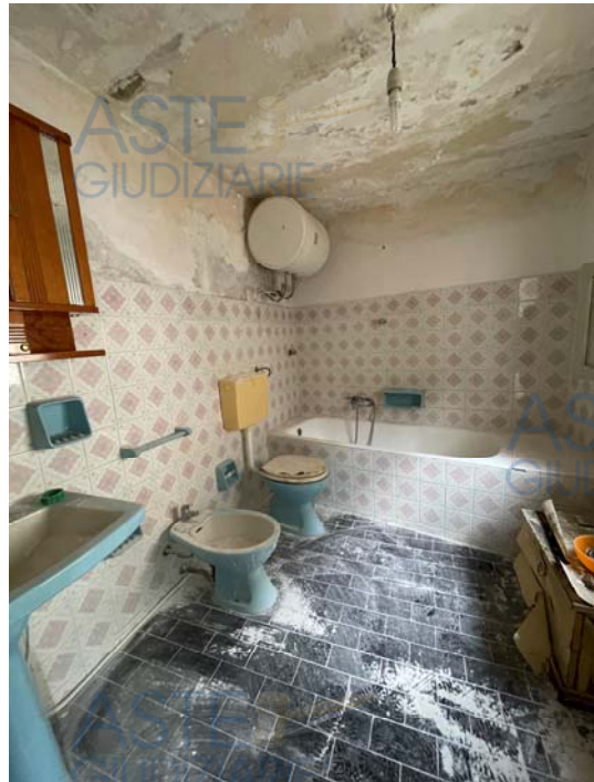
Vista del Servizio Igienico all'ultimo livello