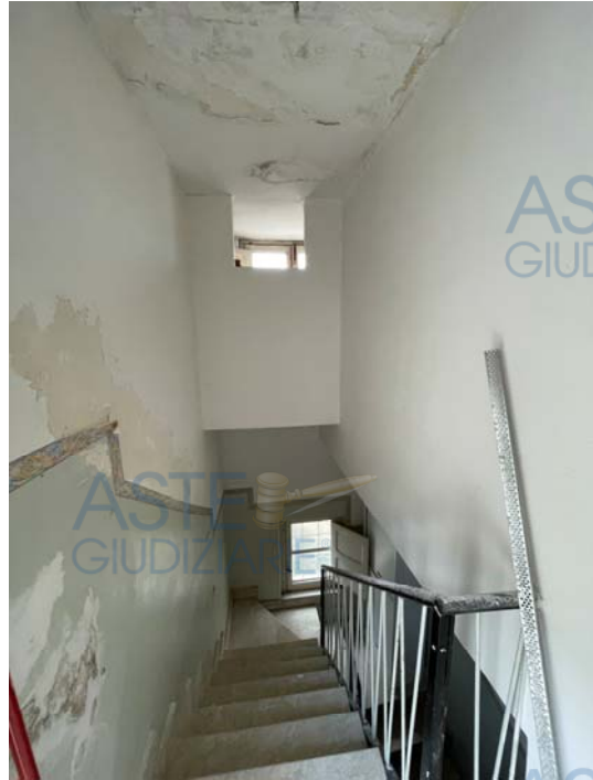
Vista della scala interna