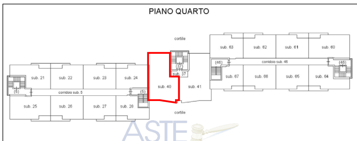
Fig. 3 – Elaborato planimetrico con individuazione LOTTO N. 31