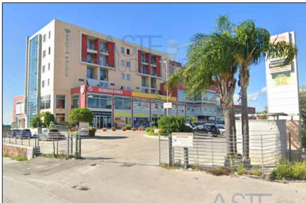
Foto 1 – Il complesso immobiliare "REGGIA PALACE" su viale Carlo III