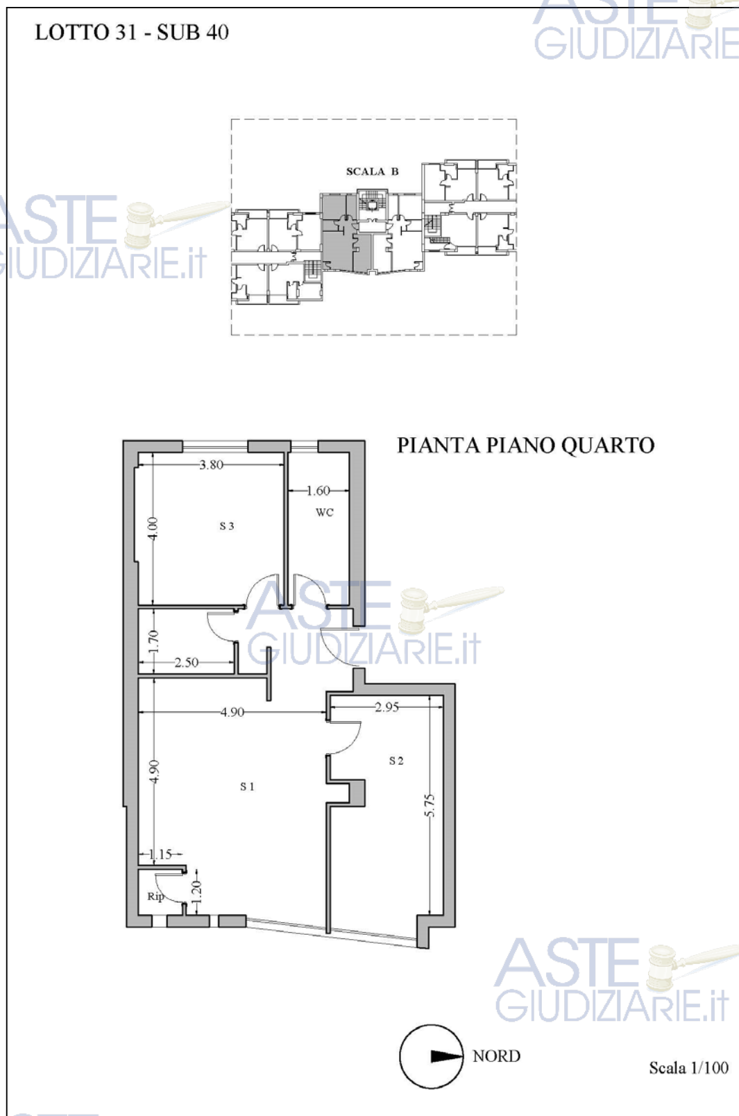
Fig. 2 - Pianta dello stato dei luoghi