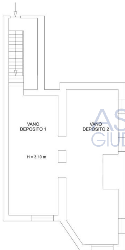
PLANIMETRIA LOCALE DEPOSITO

Costituisce pertinenza esclusiva dell'appartamento l'annessa corte esterna pavimentata posto al piano terra e il locale deposito posto, in buona parte, sulla medesima verticale al piano seminterrato, il cui accesso si guadagna dal vano scala per mezzo di una rampa di scale comune. Esso è costituito da due locali comunicanti tra loro e allo stato rustico, la cui altezza utile, misurata dal livello del piano di calpestio all'intradosso del solaio, è pari a circa 3,10 m.