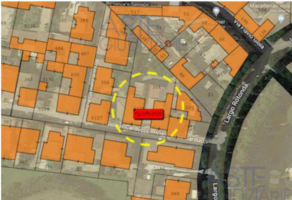
Foto n. 1 - SOVRAPPOSIZIONE VAX - ORTOFOTO

Pertanto, l'immobile posto in vendita, costituente lotto unico , è la piena ed intera proprietà di appartamento con locale deposito pertinenziale siti in San Nicola la Strada, in Via G. Carducci, n.8; confinano, nell'insieme, con Via G. Carducci, con vano scala sub 8 e con spazi comuni p.lla 354; sono riportati in N.C.E.U. di San Nicola la Strada al foglio 2, p.lla 5125, sub 5 (locale deposito) e sub 6 (appartamento).