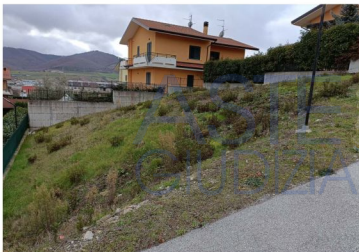
Figura 3 - Terreno edificabile.

Il terreno è ubicato nel Comune di Tito (PZ), alla Fontana Camillo, all'interno del parco residenziale, è facilmente raggiungibile da via Fontana Camillo. Il terreno presenta una pendenza verso sud-est, con una buona struttura e tessitura.