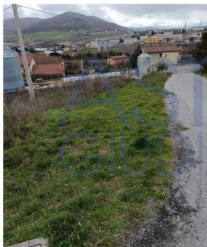
Figura 4 - Terreno (Area Relitta).

Il terreno è ubicato nel Comune di Tito (PZ), alla Via Macchia, posta lungo la strada di accesso privata, in una zona di tipo residenziale. Il terreno presenta una pendenza verso sud-est, con una buona struttura e tessitura. Il terreno risulta un'area relitta e pertanto non edificabile in quanto lo stesso terreno è stato asservito (La volumetria disponibile è stata utilizzata totalmente) precedentemente.