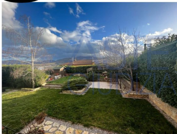
Figura 2 - Lastrico Solare.

Il Lastrico Solare è ubicato nel Comune di Tito (PZ), in Via Fontana Camillo, snc, nello stato di fatto è la copertura piana del deposito indicato in catasto al foglio 6, particella 572, sub. 1 (primo lotto). Al Lastrico Solare si accede tramite un cancello scorrevole in ferro che da su via Fontana Camillo, ed è al servizio dell'abitazione indicata in catasto al foglio 6 p.lle 351-352. Sul Lastrico Solare è stata realizzato un giardino, e lungo il perimetro è recintato da un muretto in c.a. sormontato da una ringhiera metallica. Il Lastrico Solare allo stato attuale è utilizzato dalla Sig.ra [REDACTED] in quanto risulta creditrice dell'esecutate Sig. [REDACTED]