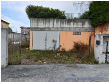
Figura 1 - Ingresso Deposito

Camillo, ed è ad uso esclusivo del deposito identificato in catasto al foglio 6, p.la 572, posto al suo interno. Il terreno è recintato lungo i lati sud ed est mediante un muretto in c.a. sormontato da una ringhiera in ferro, mentre lungo il lato nord ed il lato ovest è presente un muro in c.a che lo divide dai lotti adiacenti. Il terreno risulta essere pianeggiante, con una buona struttura e tessitura, ed un andamento pressoché regolare.