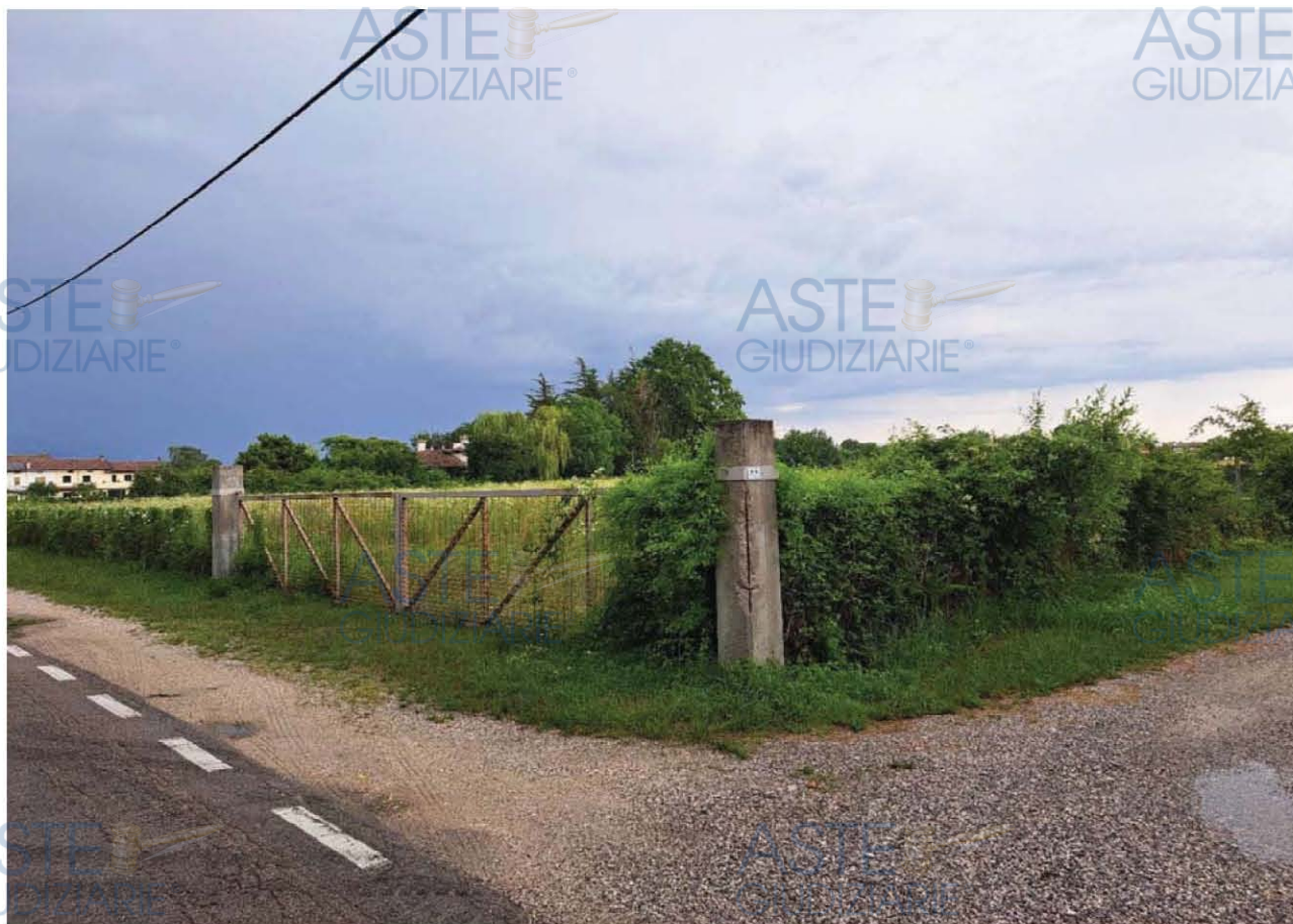
Lotto 4 – Comune di Pordenone – Foglio 26 – Veduta, da Via Fornace, del cancello di accesso ai terreni pignorati.