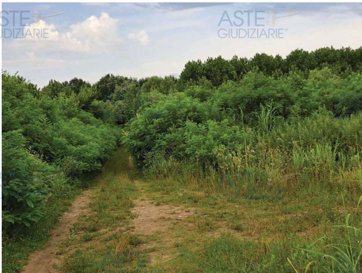
Lotto 2 – Comune di Cordenons (PN) – Foglio 45 – Veduta, da posizione est, della porzione centrale del bosco che insiste sulle particelle pignorate.

La documentazione ex art. 567 c.p.c. risulta completa? Si