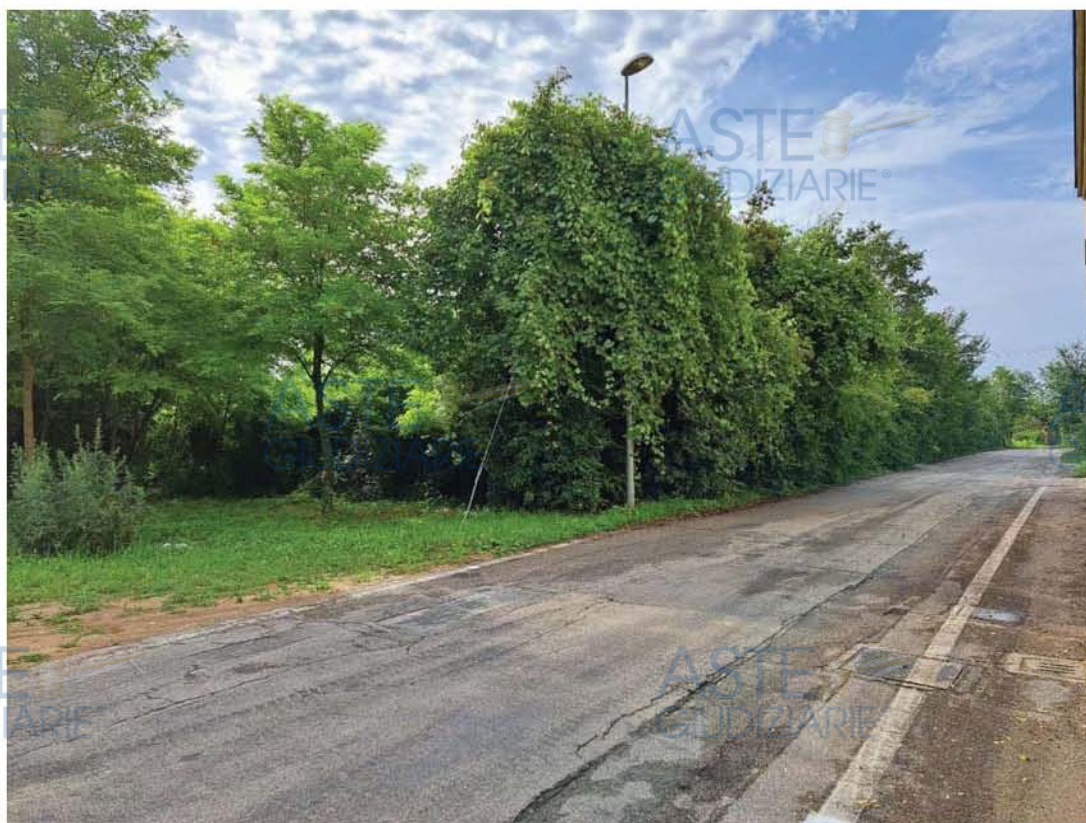
Lotto 3 – Comune di Pordenone – Foglio 26 – Veduta, da Via Fornace, di porzione ovest del bosco che insiste sulla particella n. 60.