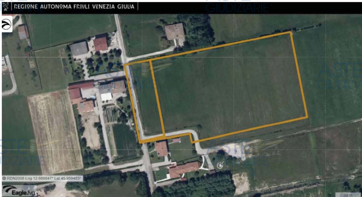
E.I. 175/2022 - LOTTO 4 – Pordenone - Foglio 26: localizzazione delle particelle 132, 375 e 558, da Eagle F.V.G.