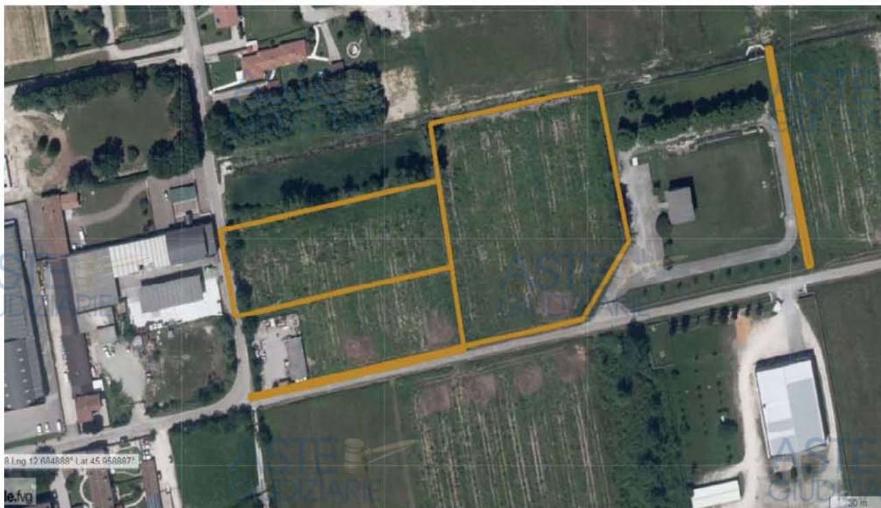
E.I. 175/2022 - LOTTO 3 – Pordenone - Foglio 26: localizzazione delle particelle 60, 92, 458 e 460, da Eagle F.V.G.