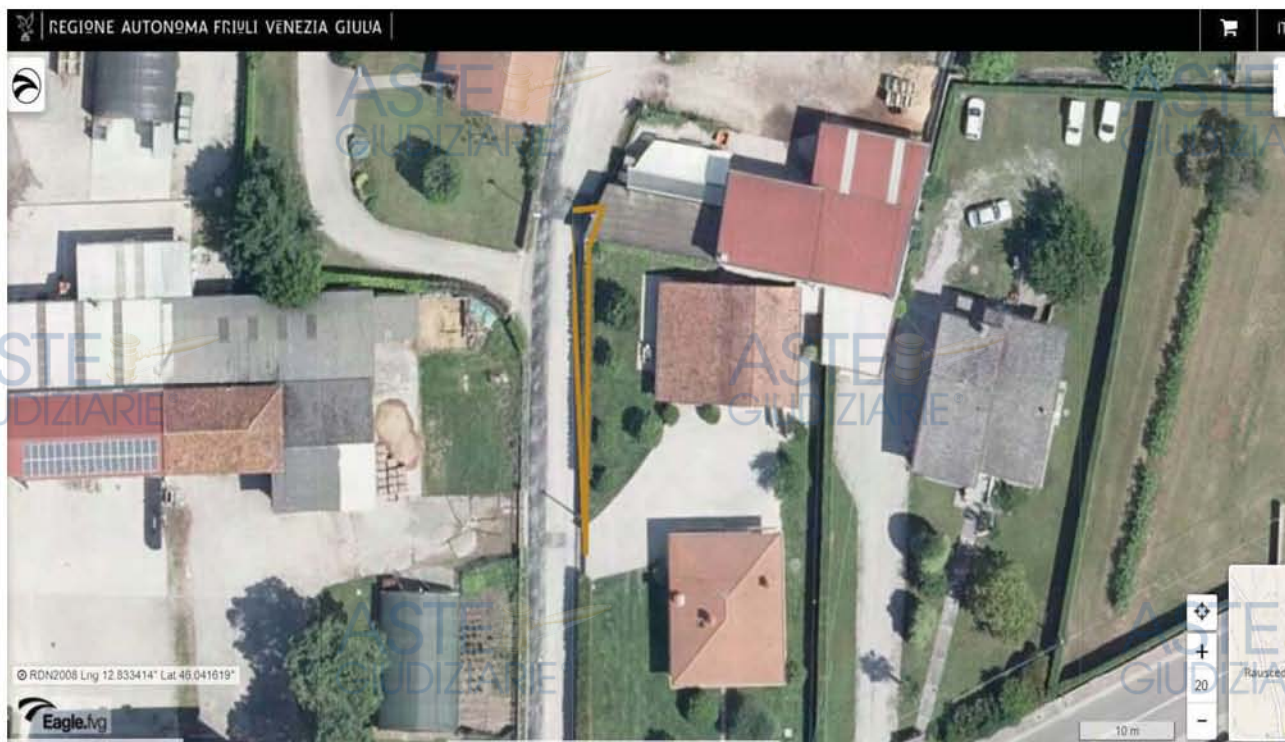
E.I. 175/2022 - LOTTO 5 - S. Giorgio della Richinvelda (PN) - Foglio 30: localizzazione della particella 1122, da Eagle F.V.G.