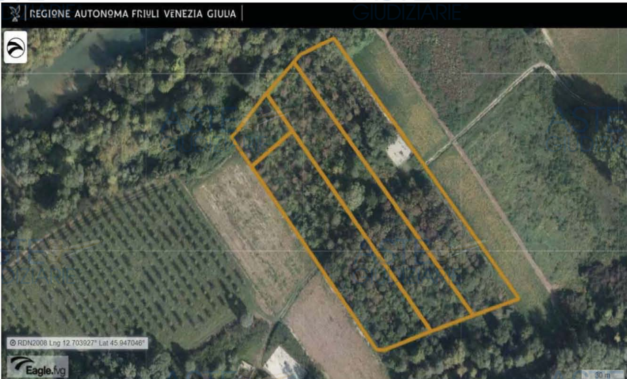
E.I. 175/2022 - LOTTO 2 - Cordenons (PN) - Foglio 45: localizzazione delle particelle 38, 43, 44 e 58