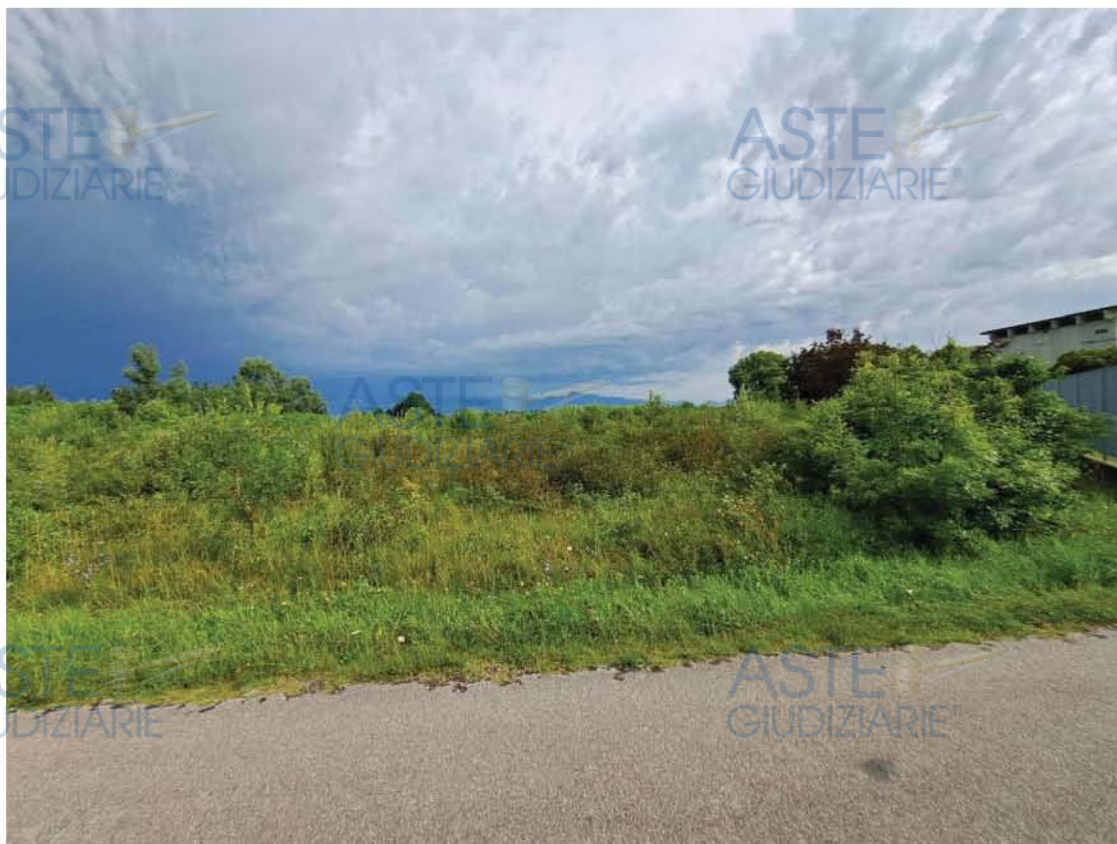
Lotto 3 - Comune di Pordenone - Foglio 26 - Veduta dei terreni investiti a bosco su porzione sud est della particella n. 92.