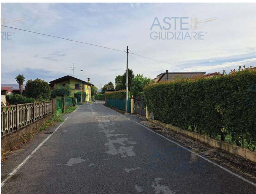
Lotto 5 – Comune di San Giorgio della Richinvelda Foglio 30 – Veduta, da Via S. Nicolò, della porzione stradale corrispondente alla particella n. 1122, posta a destra nella foto.