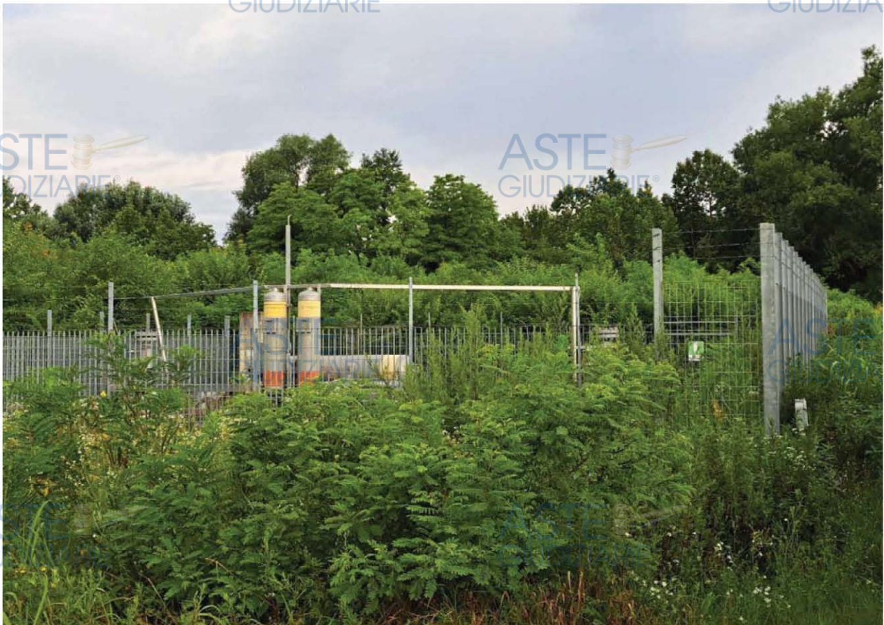
Lotto 2 – Comune di Cordenons (PN) – Foglio 45 – Veduta di parte dei terreni investiti a bosco; in primo piano la cameretta d'intercettazione della SNAM realizzata sulla particella 43 in posizione centrale, al limite est dell'impianto boschivo.