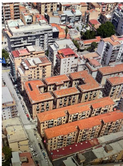
immagine n. 3 - foto dell'edificio