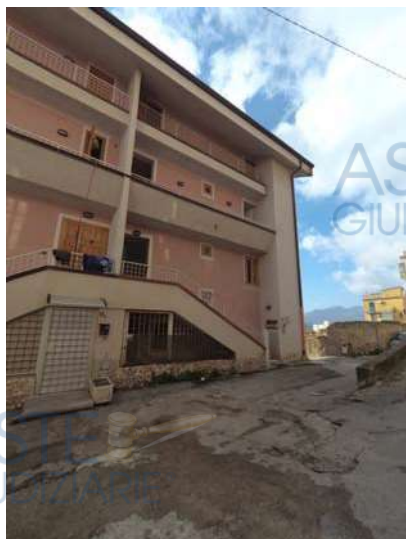
Figura 2: Vista fabbricato da via Salita Sant'Antonino

A seguito del sopralluogo effettuato in data 29/03/2019, lo scrivente ha avuto modo di appurare che il fabbricato di cui l'immobile è parte,