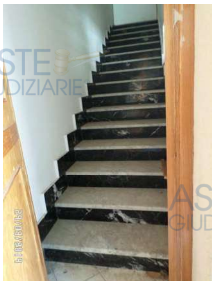
Figura 3: Vista scala ingresso immobile

Le finiture interne non sono di pregio e il loro stato risulta discreto: tutti gli ambienti, ad eccezione del bagno, sono pavimentati con mattoni in gres porcellanato, con pareti intonacate e tinteggiate. Le pareti del bagno, sono per buona parte rivestite di mattonelle, mentre la copertura e la parte rimanente delle pareti risulta intonacata e tinteggiata. Gli infissi interni sono in legno tamburato, mentre gli infissi esterni sono di buona fattura e realizzati in legno con vetri a taglio termico (All. 7, Foto 13 e 14) e persiane esterne.