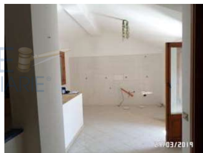
Figura 5: Vista zona cucina

All'interno del bagno, che risulta corredato di vaso, lavabo, bidet e doccia, è presente lo scaldabagno elettrico (All. 7, Foto 12). L'impianto idrico è sottotraccia, così come quello elettrico.