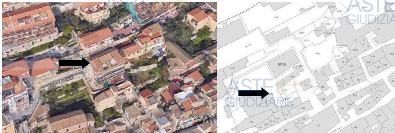
Comparazione tra stralcio maps, e stralcio di mappa catastale con indicazione del fabbricato di salita S. Antonino

Altresì, in riferimento alle difformità sostanziali si evidenzia che dai riscontri effettuati presso l'ufficio del catasto, si è appurato che l'attuale fabbricato, ed anche i singoli immobili che lo costituiscono, realizzati sulla particella 2152 non risultano accatastrati al Catasto fabbricati (per maggiori informazioni si rimanda alla risposta al successivo quesito n. 3).