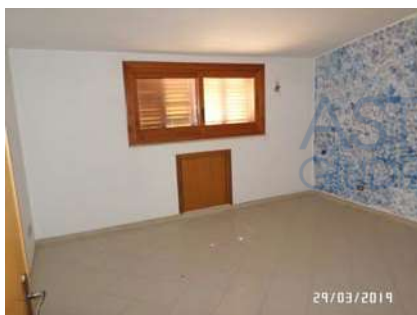
Figura 4: Vista camera da letto