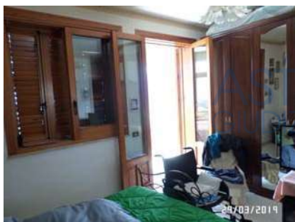
Figura 4: Vista camera da letto