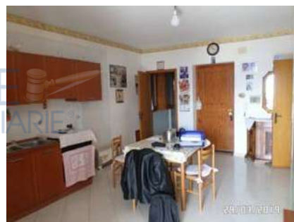
Figura 5: Vista soggiorno-cucina

All'interno del bagno, che risulta corredato di vaso, lavabo, bidet e doccia, è presente lo scaldabagno elettrico (All. 7, Foto 10). L'impianto idrico è sottotraccia, così come quello elettrico.