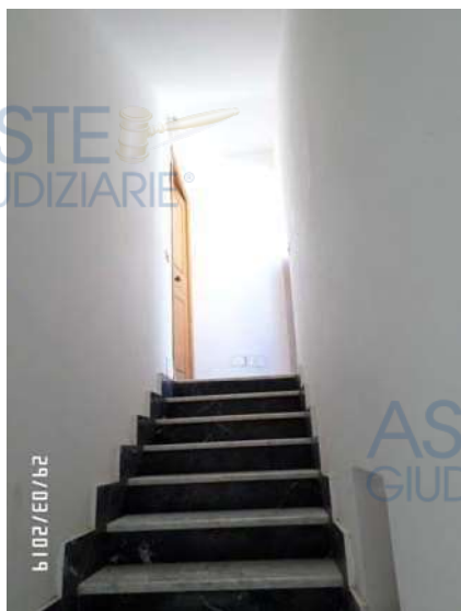
Figura 3: Vista scala ingresso immobile

Le finiture interne non sono di pregio e il loro stato risulta discreto: tutti gli ambienti, ad eccezione del bagno, sono pavimentati con mattoni in gres porcellanato (All. 7, Foto 17), con pareti intonacate e tinteggiate. Le pareti del bagno, sono per buona parte rivestite di mattonelle, mentre la copertura e la parte rimanente delle pareti risulta intonacata e tinteggiata. Gli infissi interni sono in legno tamburato (All. 7, Foto 16), mentre gli infissi esterni sono di buona fattura e realizzati in legno con vetri a taglio termico (All. 7, Foto 7) e persiane esterne (All. 7, Foto 15).