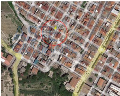
- Vista aerea con indicazione del fabbricato pignorato-

vicinanze e in particolare lungo corso Umberto I, sono presenti locali commerciali, uffici pubblici; vi sono discrete possibilità di parcheggio.