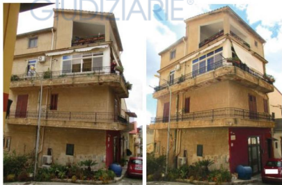
-immagini del fabbricato pignorato dalla via Pergole e via Canepa -

-Attestato di prestazione energetica (APE)- L'immobile in esame non è dotato di Attestato di prestazione energetica -APE così come verificato tramite presso il Catasto energetico fabbricati della regione Sicilia- (vedi allegato 10).