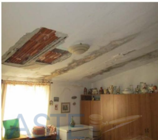
-vista della copertura di un ambiente di piano terzo (sottotetto)-

manutenzione già attuato per arginare i fenomeni di degrado evidenziati.