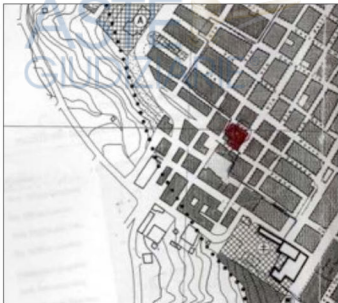
-Estratto dalla tavola di PRG Elaborato 10/a-

Destinazione urbanistica: Il bene oggetto pignoramento rientra in ZTO B "aree residenziali esistenti e di completamento" normata da specifiche norme del PRG vigente nel comune di San Giuseppe Jato adottato con Del. Comm. Reg.le n.01 del 25/03/1996 approvato con modifiche e correzioni con Decreto ARTA del 10/08/1999 dell GURS del 29/10/1999 n.51, descritte nel Certificato di destinazione urbanistica rilasciato il 28/07/2023 (vedi allegato 6), ubicata in zona con vincolo sismico, e