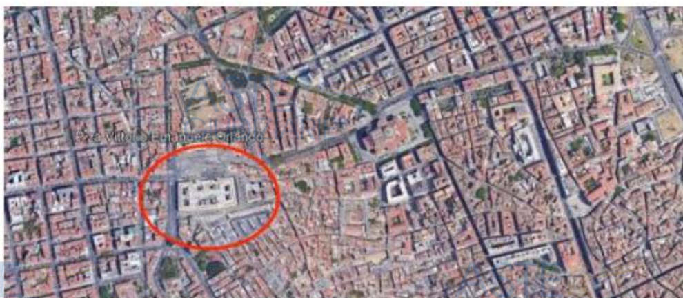
Immagine satellitare tratta da Google Earth con individuazione dell'area in cui ricadono gli immobili oggetto di stima