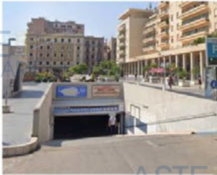
Rampa di accesso al parcheggio

corredata degli impianti necessari per l'uso a cui è destinato (elettrico, idrico, antincendio, aereazione, ...). Le pareti ed i soffitti sono intonacati e tinteggiati (foto n. 8...10).