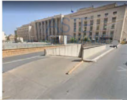
Rampa di uscita dal parcheggio