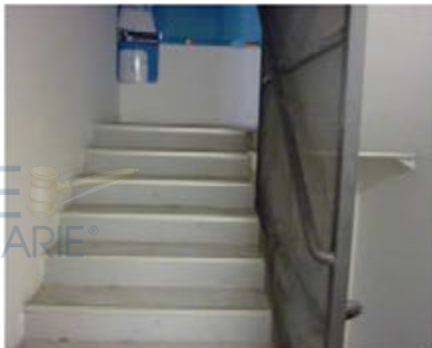
Scala di collegamento interna