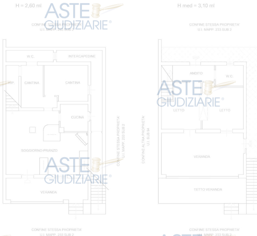
FOTO 5 - Pianta_appartamento dopo rilievo primo accesso

Caratteristiche costruttive (vedasi anche i dati riportati nel verbale di primo accesso allegato alla presente)