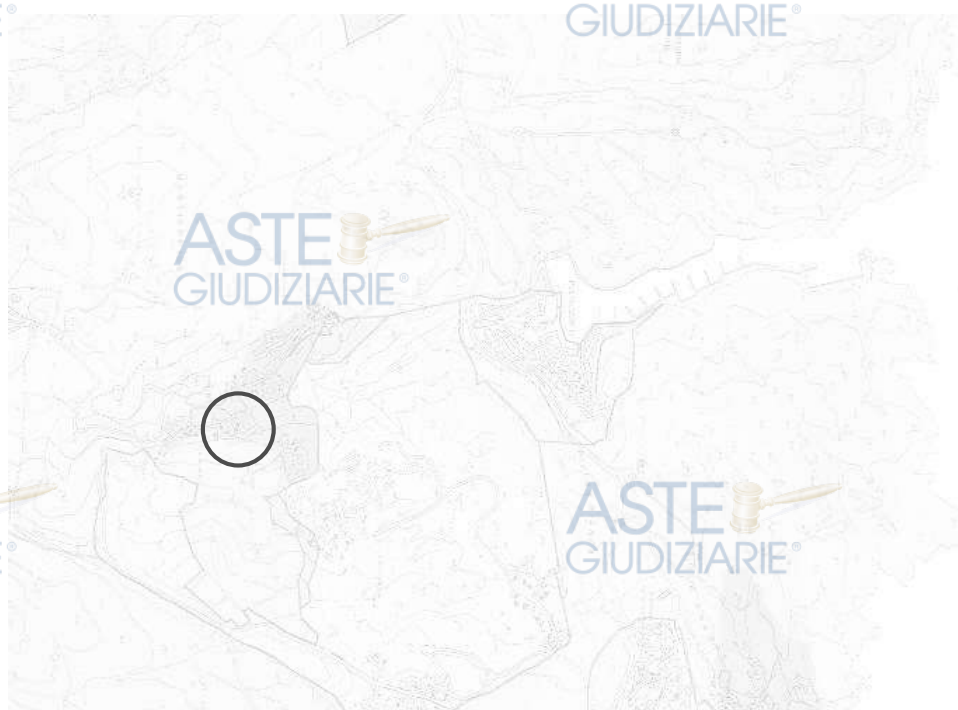
Foto – estratto della tavola P. di F. Inquadramento territoriale zona F - comune di Arzachena (SS)

Gli strumenti urbanistici (Piano di Fabbricazione) del Comune di Arzachena individuano l'area, su cui insiste l'immobile pignorato zona urbanistica zona F2 (di interesse turistico di completamento) ; la disciplina urbanistica e edilizia di dette zone è quella stabilita dall'art. 63 delle NTA dello strumento attuativo vigente (PdiF).