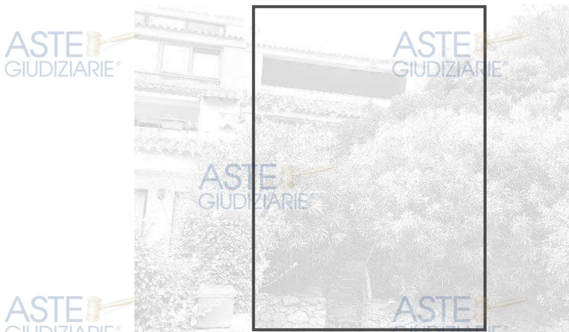
Foto 4 - Appartamento su compendio turistico

In sede di sopralluogo e quindi, di espletamento delle operazioni di accesso all'immobile, si è proceduto a verificare mediante rilievo metrico lo stato di fatto comparandolo con la planimetria catastale e la documentazione progettuale allegata ai titoli abilitativi a costruire. Da detta comparazione è emerso che alcune partizioni interne non corrispondono allo stato