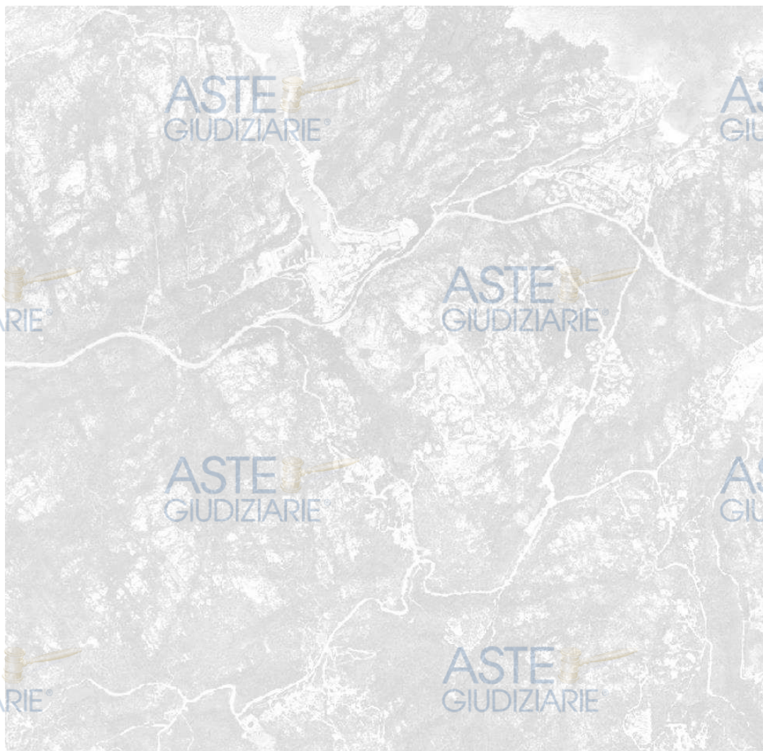
Foto 1 - Inquadramento territoriale – loc.tà Lu Cumitoni–Porto Cervo comune di Arzachena (SS)

L'immobile, oggetto del pignoramento, si trova quindi in: