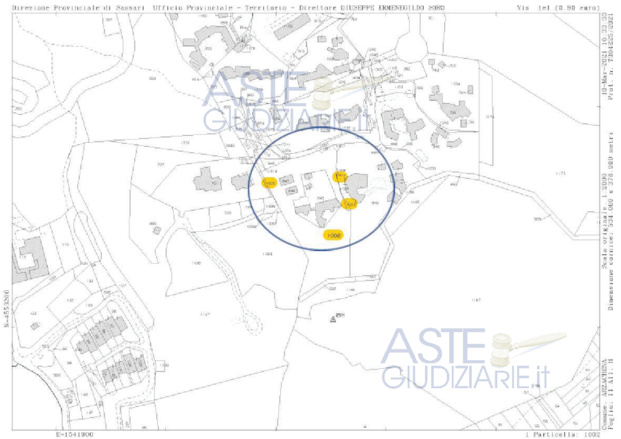
a3) estratto mappa catastale