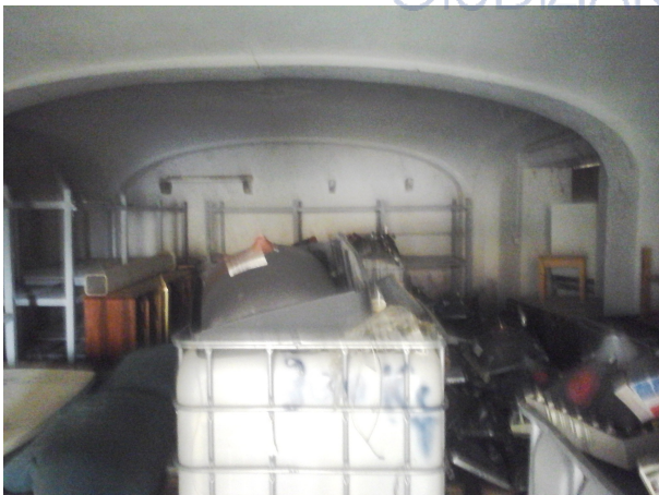
Magazzino al piano terra