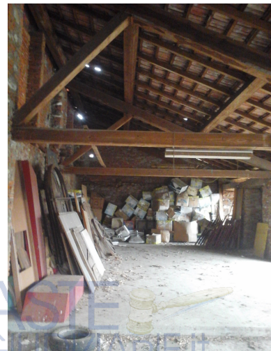
Piano primo con copertura "a vista"