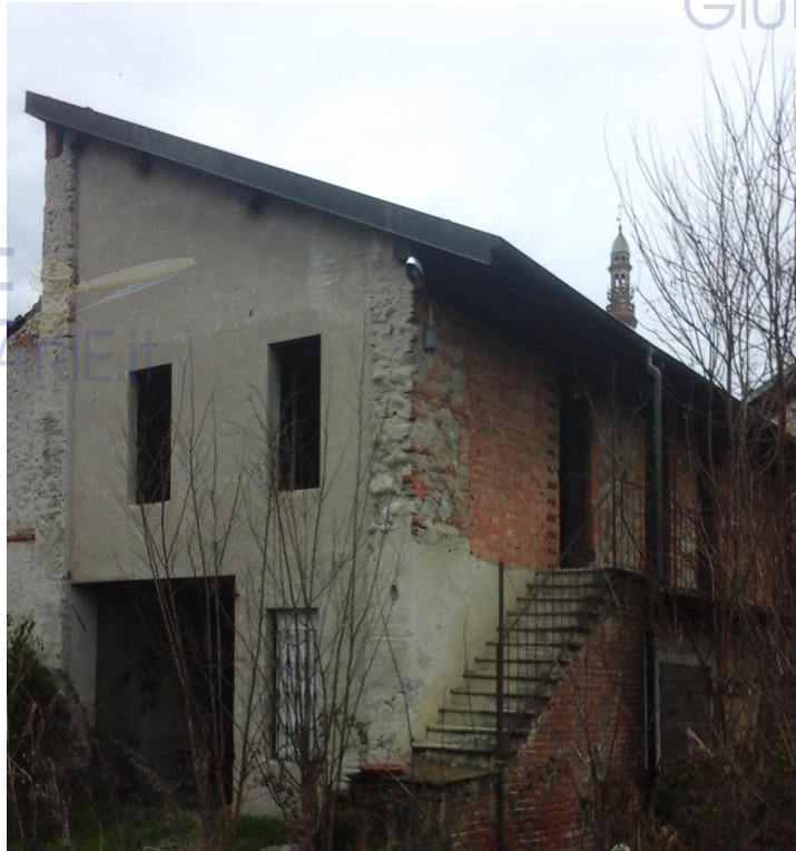
prospetto fabbricato principale

Descrizione Unità Immobiliare di cui al punto A