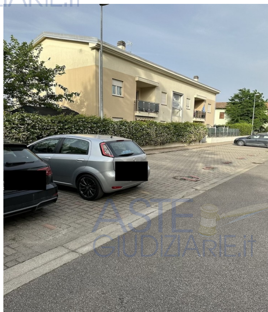
Foto n.6 - Panoramica stalli