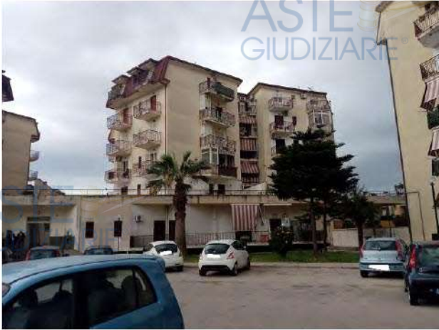
Vista d'insieme del fabbricato A

La superficie interna utile complessiva è pari a mq. 95,10, con altezza interna di m. 2,75. Inoltre, vi sono quattro balconi, uno sul lato Nord-Est di mq. 7,35, due sul lato Nord-Ovest di mq. 4,00 ciascuno e uno sul lato Sud-Ovest di mq. 6,00, tutti prospicienti l'area scoperta comune del fabbricato.