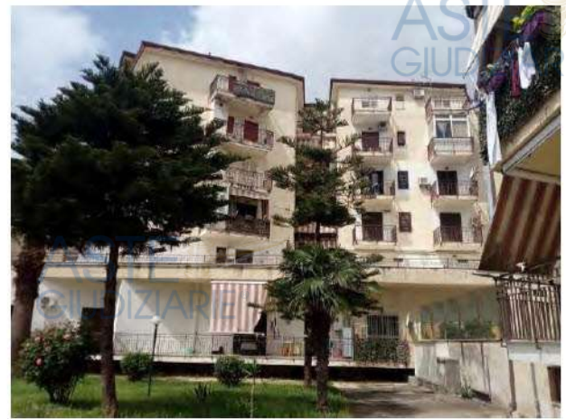
Altra vista del fabbricato A

La porta di ingresso immette direttamente nel vano soggiorno, sul cui lato sinistro vi è la cucina con annesso ripostiglio, mentre in posizione frontale vi è la porta del disimpegno, posto in posizione centrale e baricentrica, da cui si accede alle due camere da letto e ai bagni.