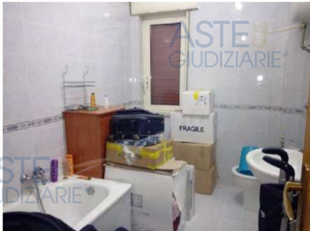
Uno dei due bagni

Sulla base di tutto quanto sopra descritto, lo stato di manutenzione generale degli immobili può definirsi buono.