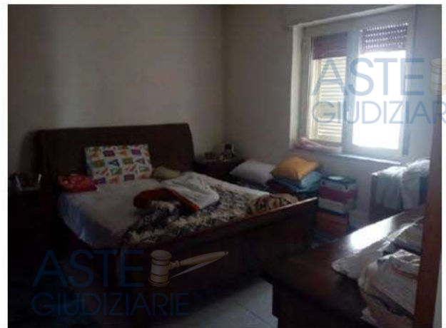
Seconda camera da letto