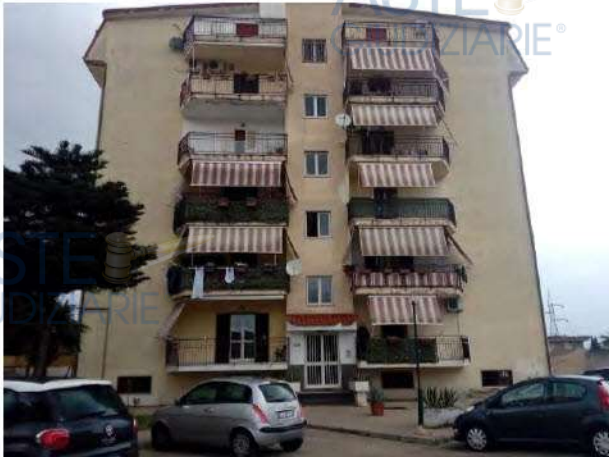
Vista d'insieme del fabbricato A

La porta di ingresso immette direttamente nel vano soggiorno, sul cui lato destro vi è la cucina, mentre in posizione frontale vi è la porta del disimpegno, posto in posizione centrale e baricentrica, da cui si accede alle due camere da letto e ai bagni.