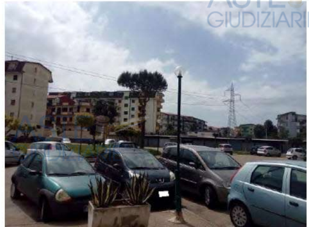
Vista del piazzale del complesso immobiliare