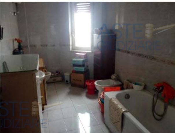
Bagno con vasca

L'appartamento non è dotato di A.P.E. – Attestato di Prestazione Energetica, che potrà essere rilasciato con un costo stimabile in Euro 200,00.