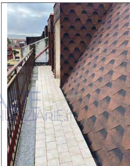
Fotografia n. 7 _ Balcone est