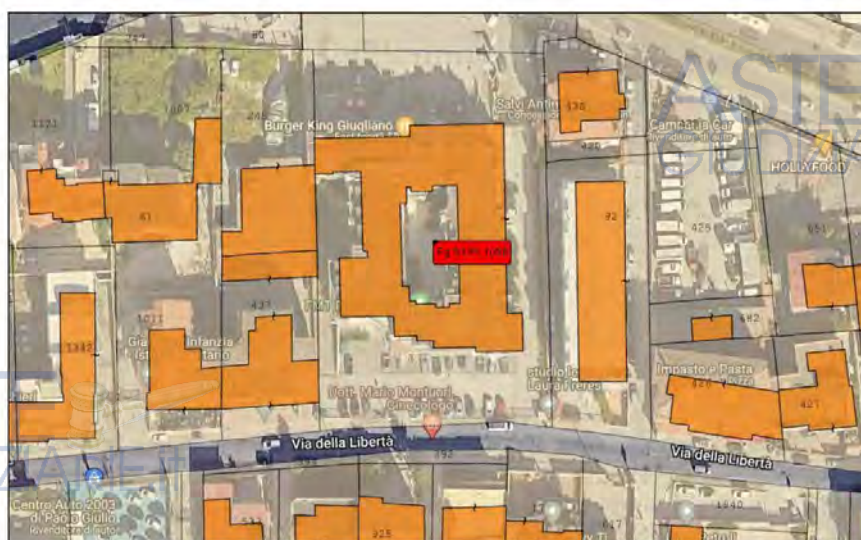
Figura n. 3 – Sovrapposizione della mappa catastale all'ortofoto