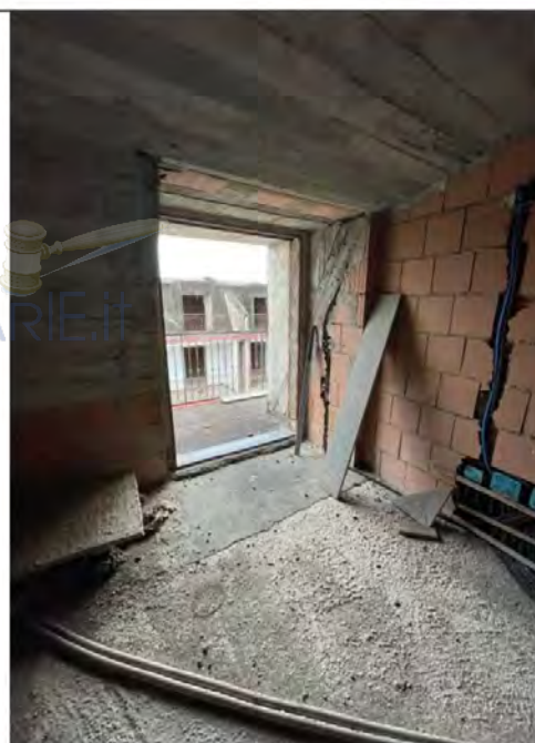
Fotografia n. 10 _ vano con affaccio ovest