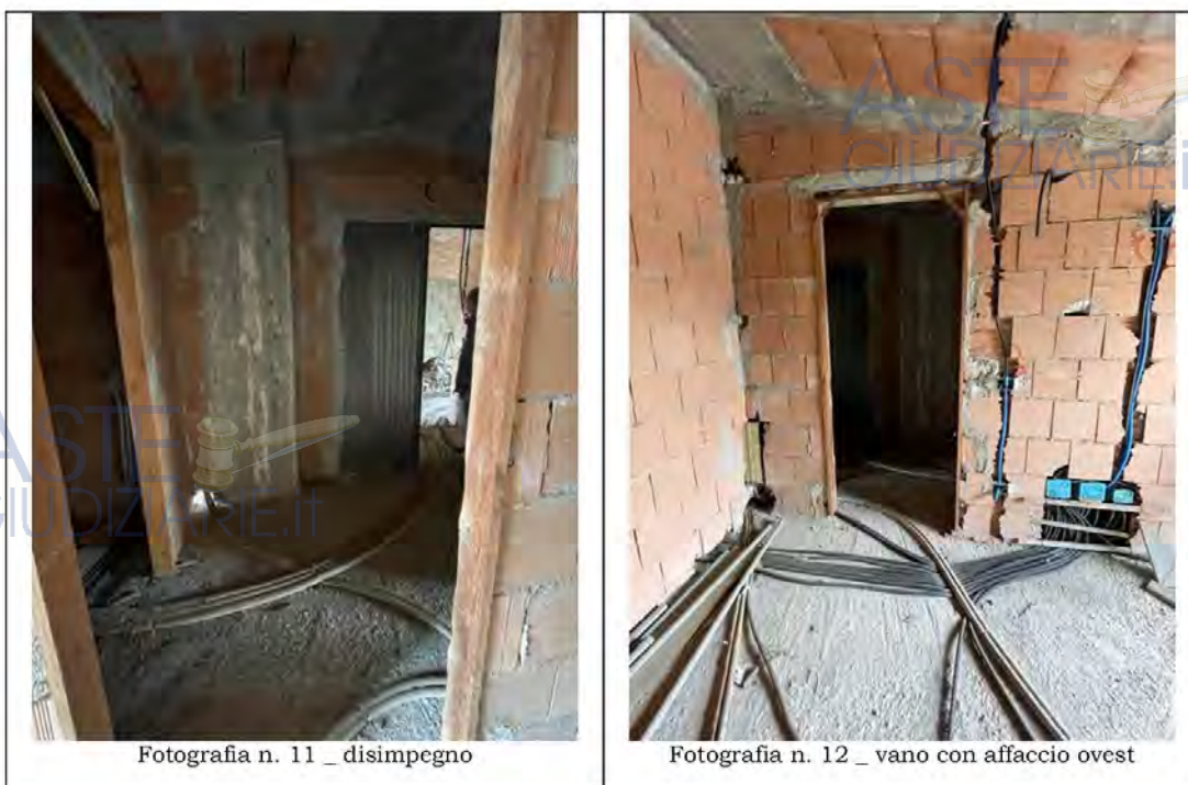
Fotografia n. 11 _ disimpegno