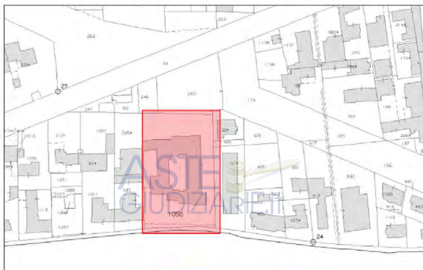
Figura n. 2 - Estratto mappa catastale

Si riporta altresì la sovrapposizione tra le due mappe: