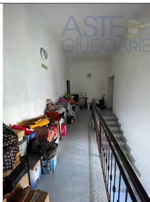
Fotografia n. 8 _ Ballatoio della scala al terzo piano