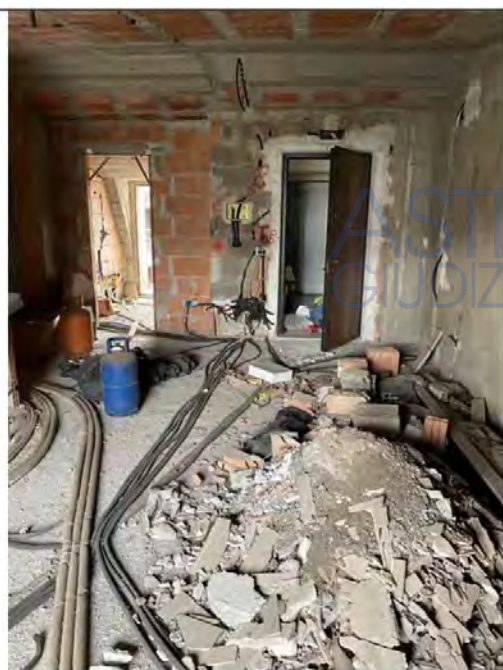
Fotografia n. 9 _ Ingresso