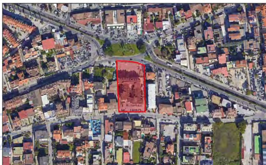
Figura n. 1 - Ortofoto