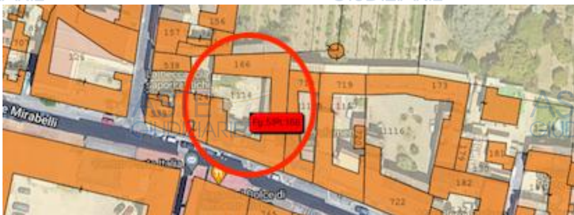
Foto n. 1 - SOVRAPPOSIZIONE VAX - ORTOFOTO

La sovrapposizione tra estratto di mappa ed ortofoto, individua correttamente il cespite pignorato.