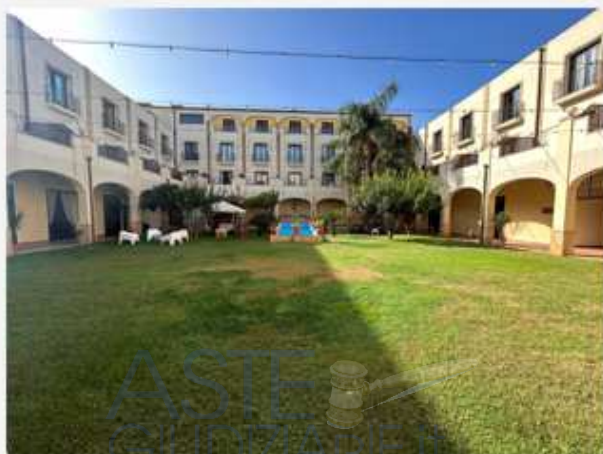
Figura 3 - Vista aree esterne.