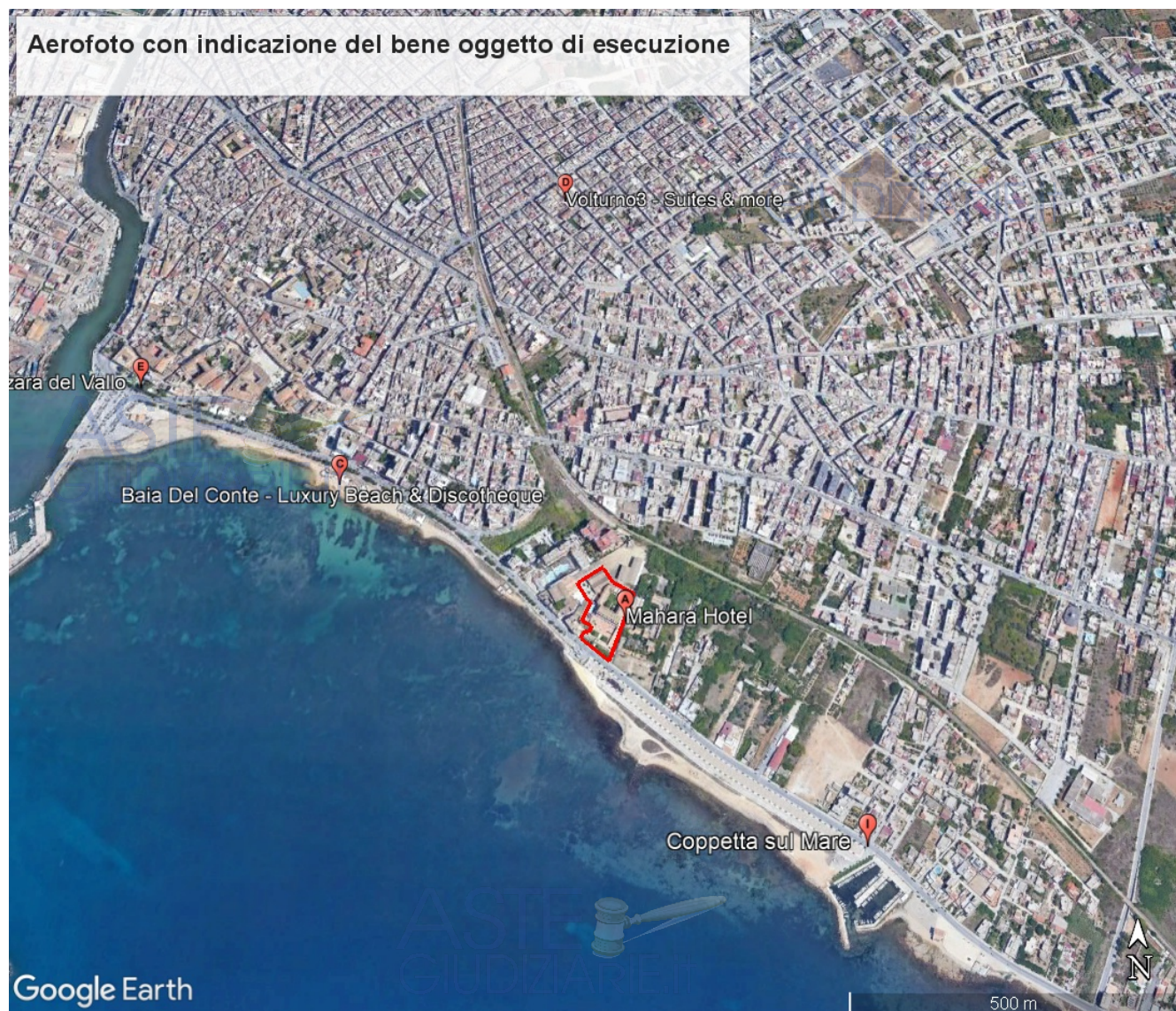
Figura 1 – Aerofoto tratta da Google, In rosso , è indicato il bene oggetto di esecuzione