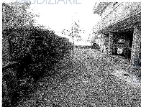
Area di accesso - Lato Est