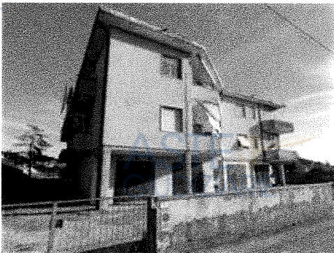
Vista dalla strada - Lato Nord