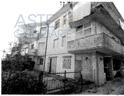
Resede esclusiva - Lato Sud-Est