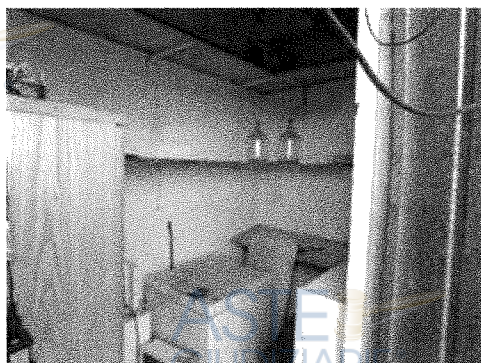
Vano accessorio con accesso da resede esclusiva