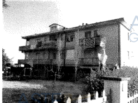
Vista dalla strada - Lato Est