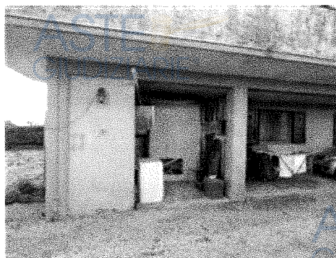
Porzione di porticato esclusivo