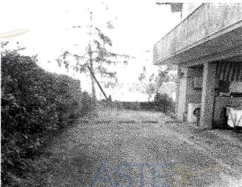
Resede esclusiva - Lato Est