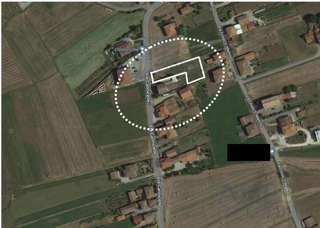
Ortofoto con individuazione dell'immobile