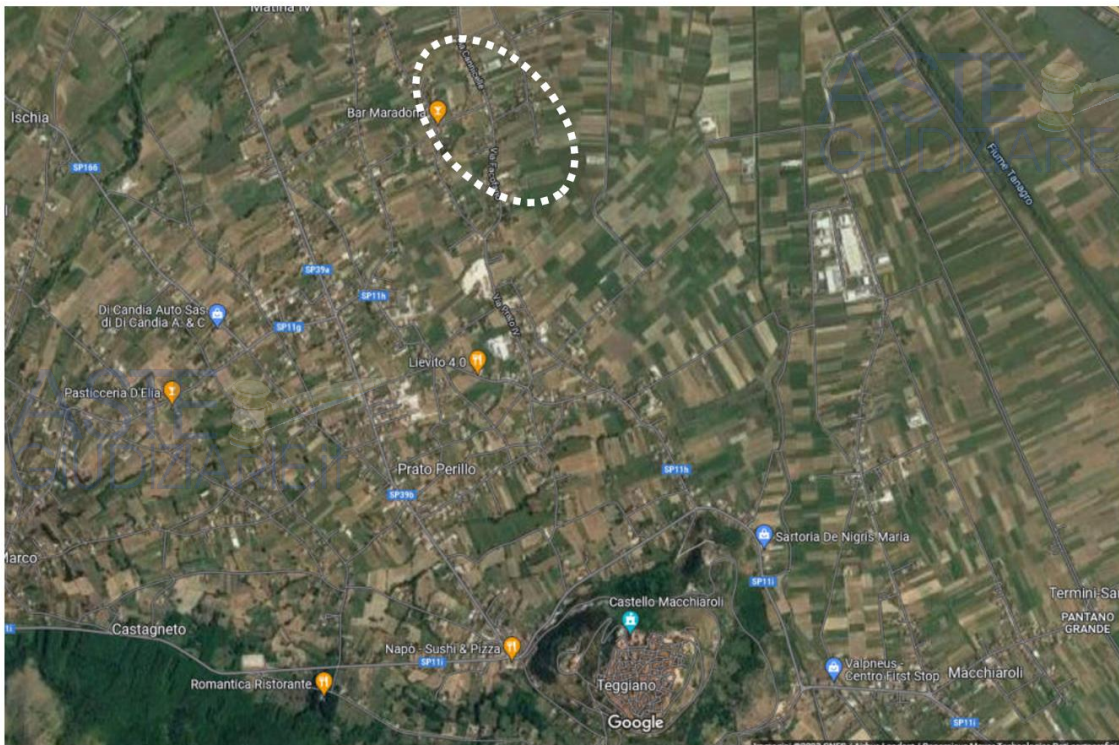
Ortofoto con individuazione dell'immobile