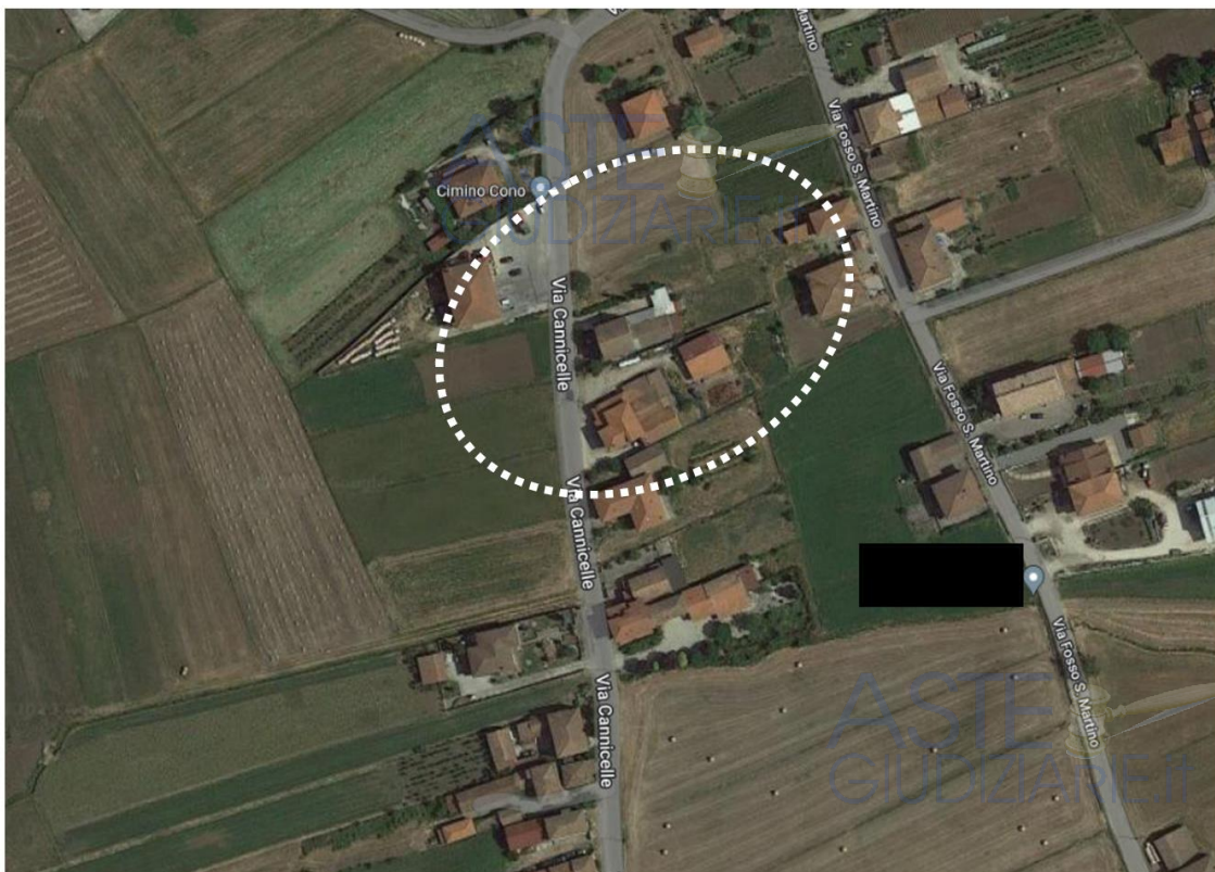
Ortofoto con individuazione dell'immobile