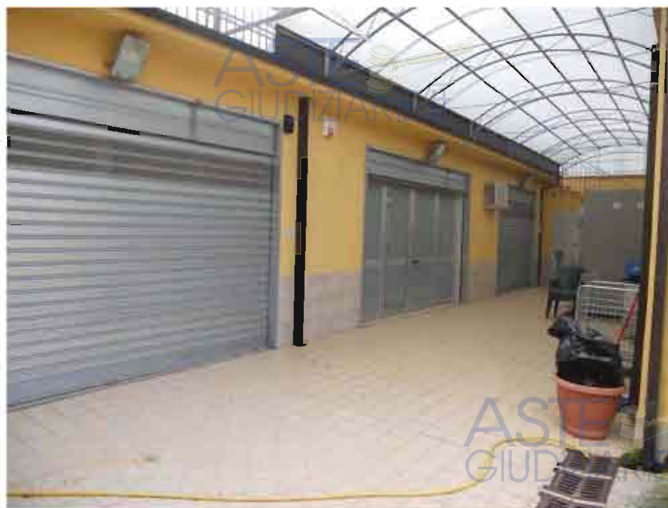
Foto 3 - Prospetto principale ingresso