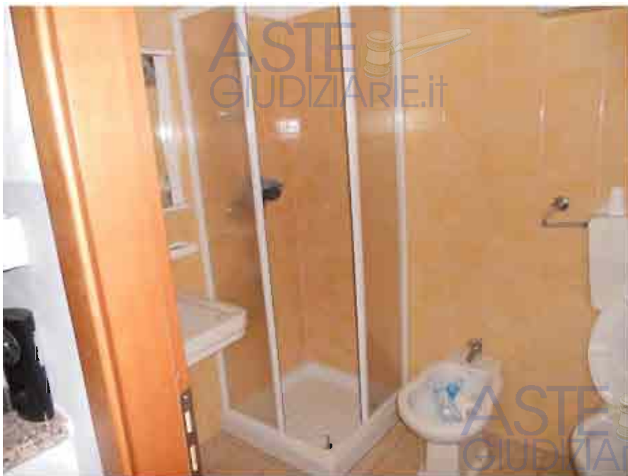
Foto 9 - Interno laboratorio