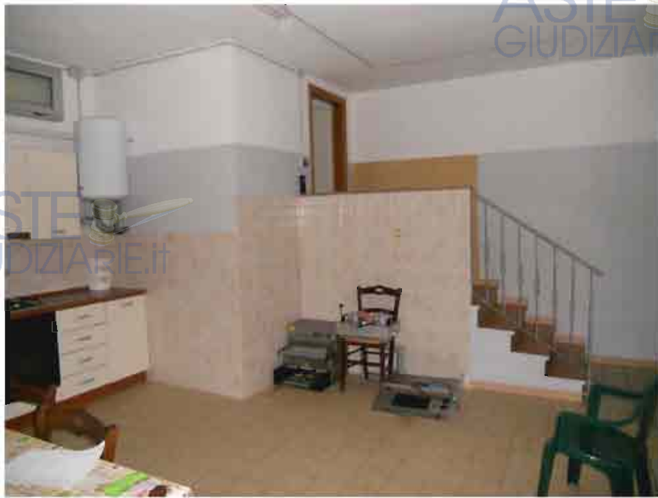
Foto 8 - Interno laboratorio