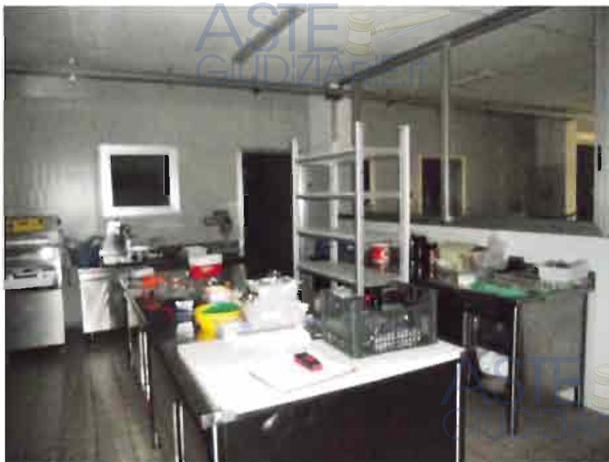
Foto 6 - Interno laboratorio