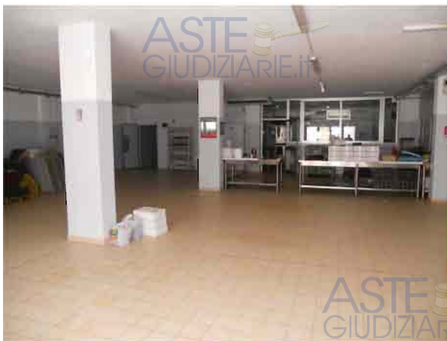
Foto 5 - Interno laboratorio