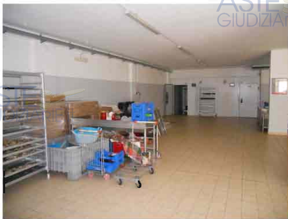
Foto 4 - Interno laboratorio