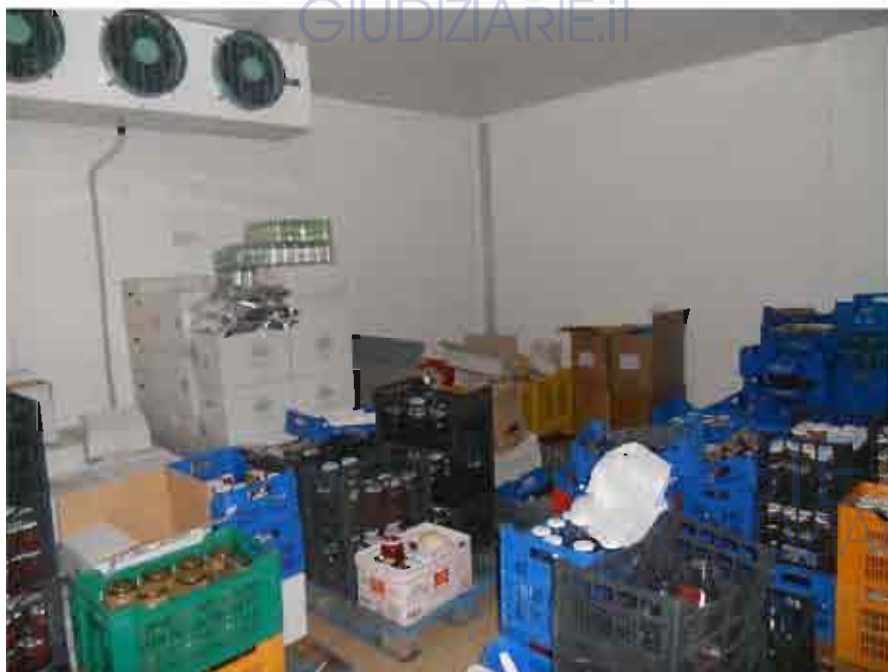
Foto 11 - Interno laboratorio