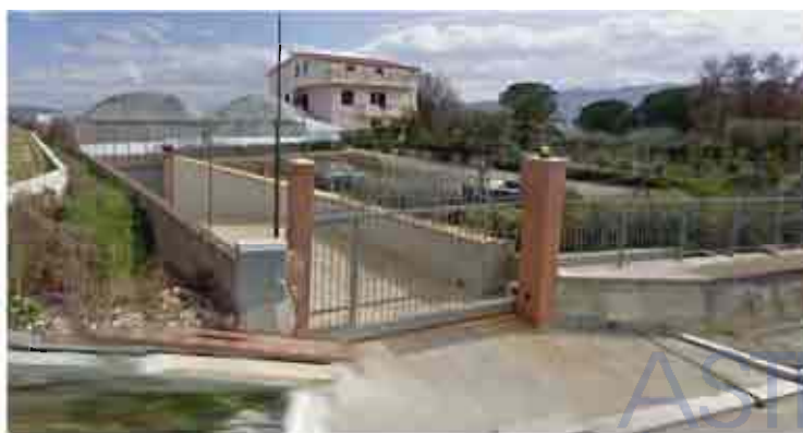
Foto 2 - Vista dell'ingresso