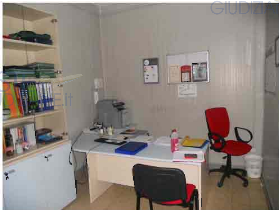
Foto 10 - Interno laboratorio