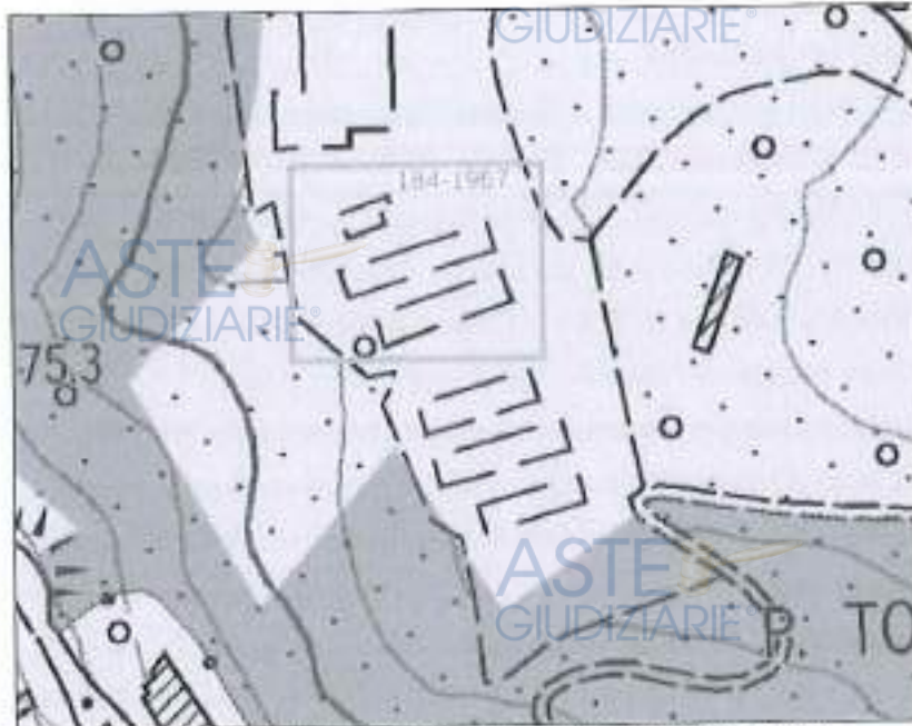
Estratto del PIT Regione Toscana – Vincolo Paesaggistico