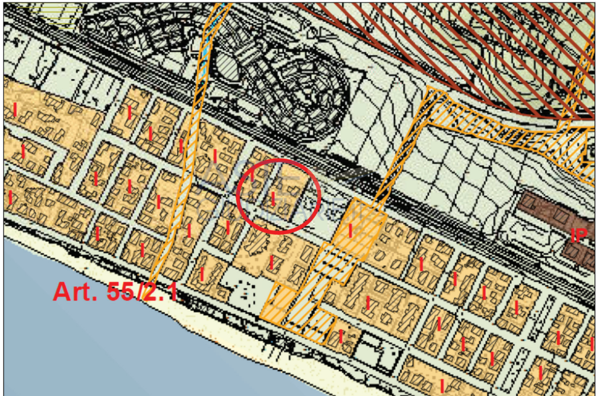
Regolamento Urbanistico del Comune di Follonica – Tavola 1 – Tessuti Isolati

9. Per favorire l’obiettivo del riuso del patrimonio edilizio esistente da abitazioni non occupate (seconde case) in abitazioni per residenza permanente o in strutture ricettive alberghiere e/o turistiche ricettive con funzioni compatibili con il sistema della struttura residenziale e dei servizi per la residenza e per il turismo, possono essere disposti dal Consiglio Comunale appositi incentivi economici o forme di detassazione, anche mediante riduzione degli oneri di urbanizzazione dovuti. L’entità, i requisiti e le casistiche per l’applicazione di tali incentivi sono disposte con apposito provvedimento consiliare a cui seguirà atto d’obbligo con la parte.