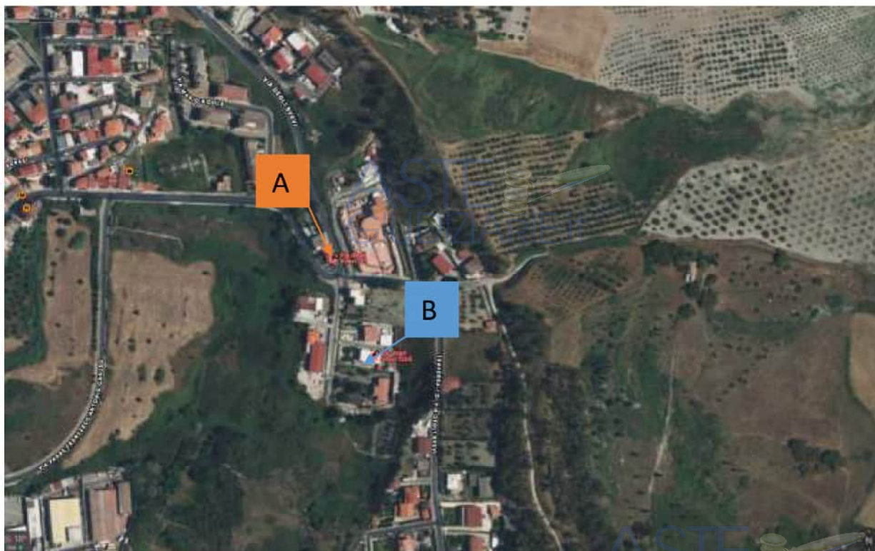
Immagine satellitare (Mappe by Apple) con ubicazione degli immobili oggetto del procedimento

La zona, prevalentemente residenziale, è provvista di servizi di urbanizzazione primaria (acquedotto e fognatura Comunale, scuole), nonché di piccole realtà commerciali quali alimentari e bar, tipiche dei quartieri periferici come quello in esame.