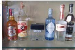
Lotto 2 (8)