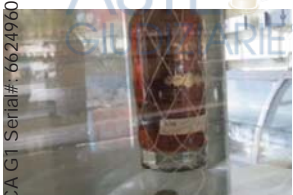
Lotto 2 (21)