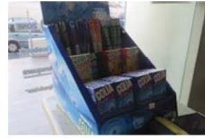
Lotto 2 (5)