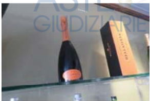
Lotto 2 (11)