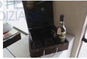
Lotto 2 (4)