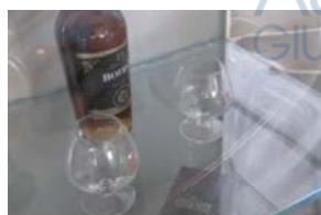
Lotto 2 (23)