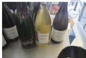
Lotto 2 (13)