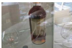
Lotto 2 (22)