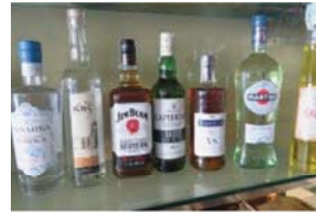
Lotto 2 (9)