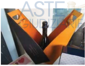
Lotto 2 (1)