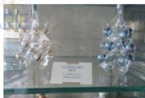
Lotto 2 (18)