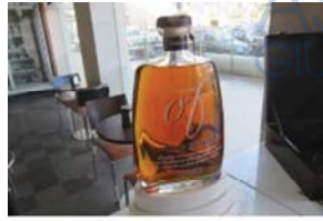
Lotto 2 (3)