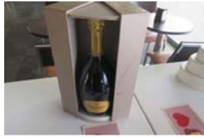
Lotto 2 (2)