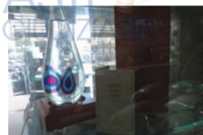
Lotto 2 (20)