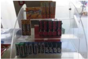
Lotto 2 (6)