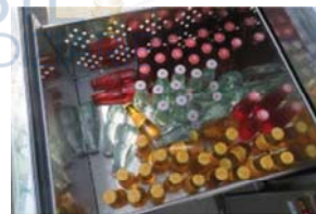
Lotto 2 (14)