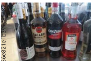
Lotto 2 (16)