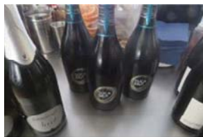
Lotto 2 (12)