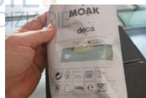
Lotto 2 (24)

Firmato Da: alessio destro Emesso Da: ArubaPEC EU Qualified Certificates CA GI Serial#: 6624960c31145b86e821e1b597763829