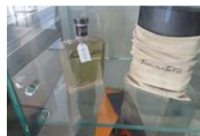
Lotto 2 (19)