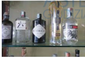
Lotto 2 (7)