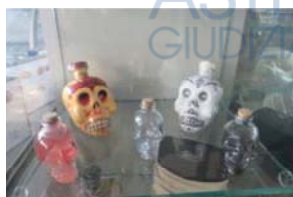
Lotto 2 (17)