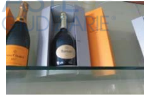
Lotto 2 (10)