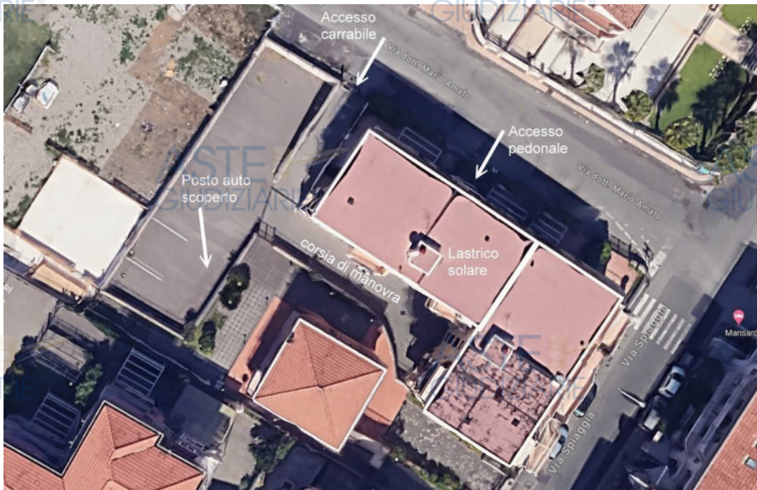
Fotografia aerea estrapolata da Google Maps

Il lastrico solare (terrazza di copertura) non è raggiungibile dal vano scala condominiale e nemmeno dall'appartamento sottostante. Pertanto, allo stato attuale serve solo da copertura dello stabile.