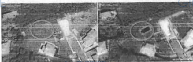
Figura 8 - Stralcio google earth al 05/2006

L'epoca di realizzazione dello stesso è da individuarsi fra il 05/2006 ed il 03/2007, come dai sottostanti stralci google earth: