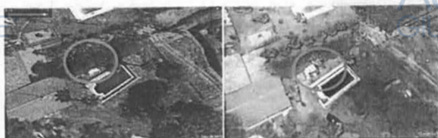
Figura 10 - Stralcio google earth al 05/2022

L'epoca di realizzazione dello stesso è da individuarsi fra il 05/2022 ed il 05/2023, come dai sottostanti stralci google earth: