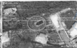
Figura 5 - Stralcio google earth al 07/2009