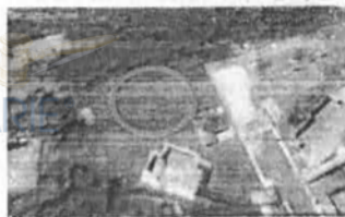
Figura 4 - Stralcio google earth al 03/2007