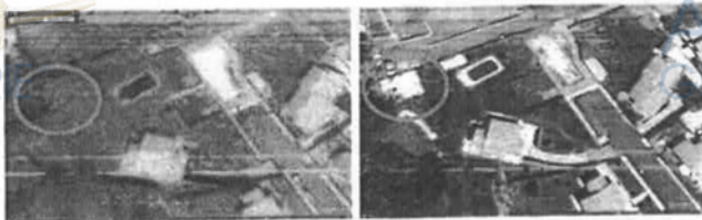
Figura 6 - Stralcio google earth al 04/2012