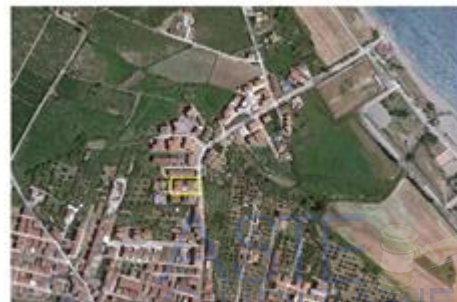
Catastale su ortofoto