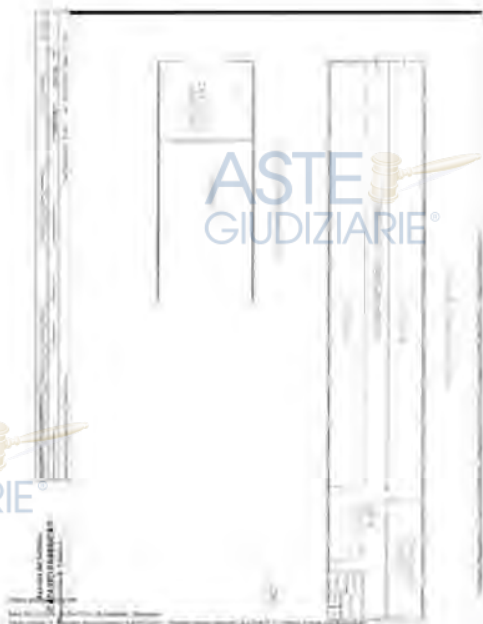
PLANIMETRIA CATASTALE STALLA E FIENILE