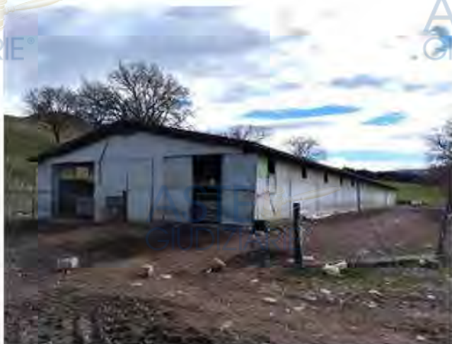
PROSPETTO NORD STALLA

L'intero edificio sviluppa 1 piano, 1 piano fuori terra, 0 piano interrato.