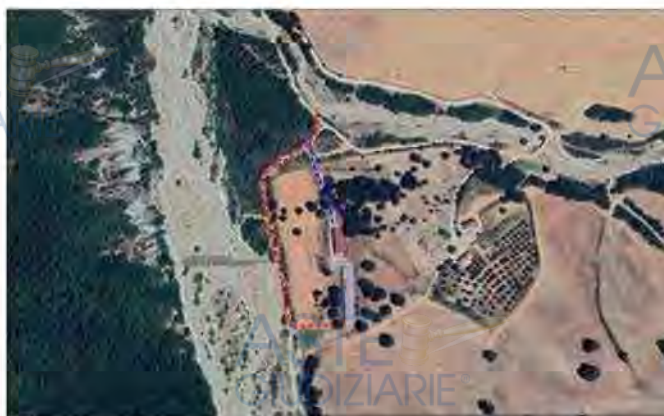
ORTO FOTO CON INDICAZIONE DELLE VIE D'ACCESSO