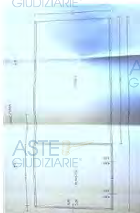
FIENILE STATO DI FATTO