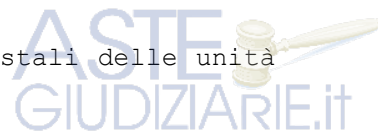
TAVOLA I ELENCO IMMOBILI

Vengono di seguito riportati i riferimenti catastali delle unità immobiliari