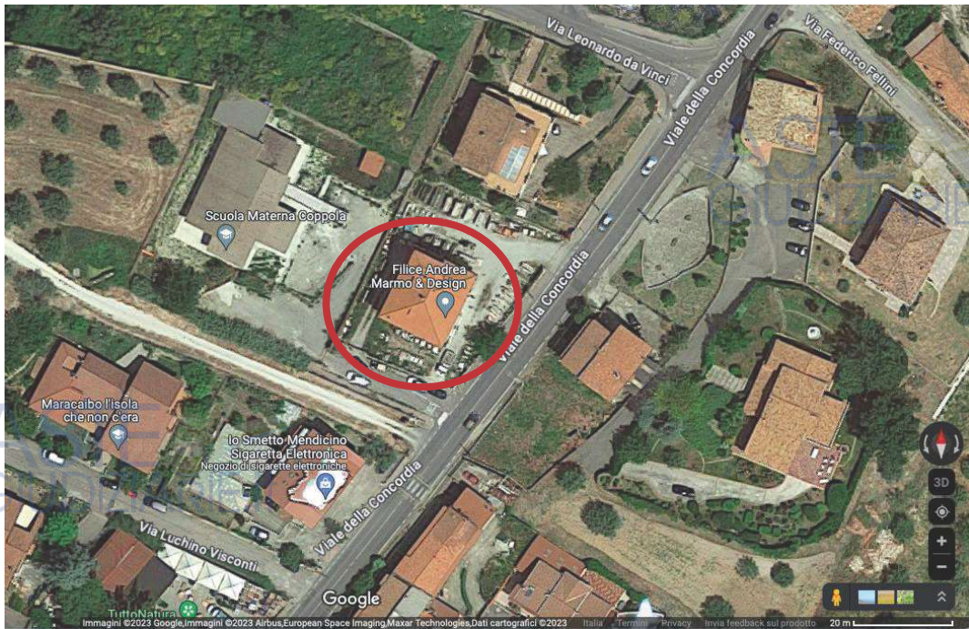
Figura 1 – Vista dall’alto del complesso residenziale

La realizzazione del corpo di fabbrica risale alla fine degli anni Settanta; esternamente presenta uno discreto stato di manutenzione.