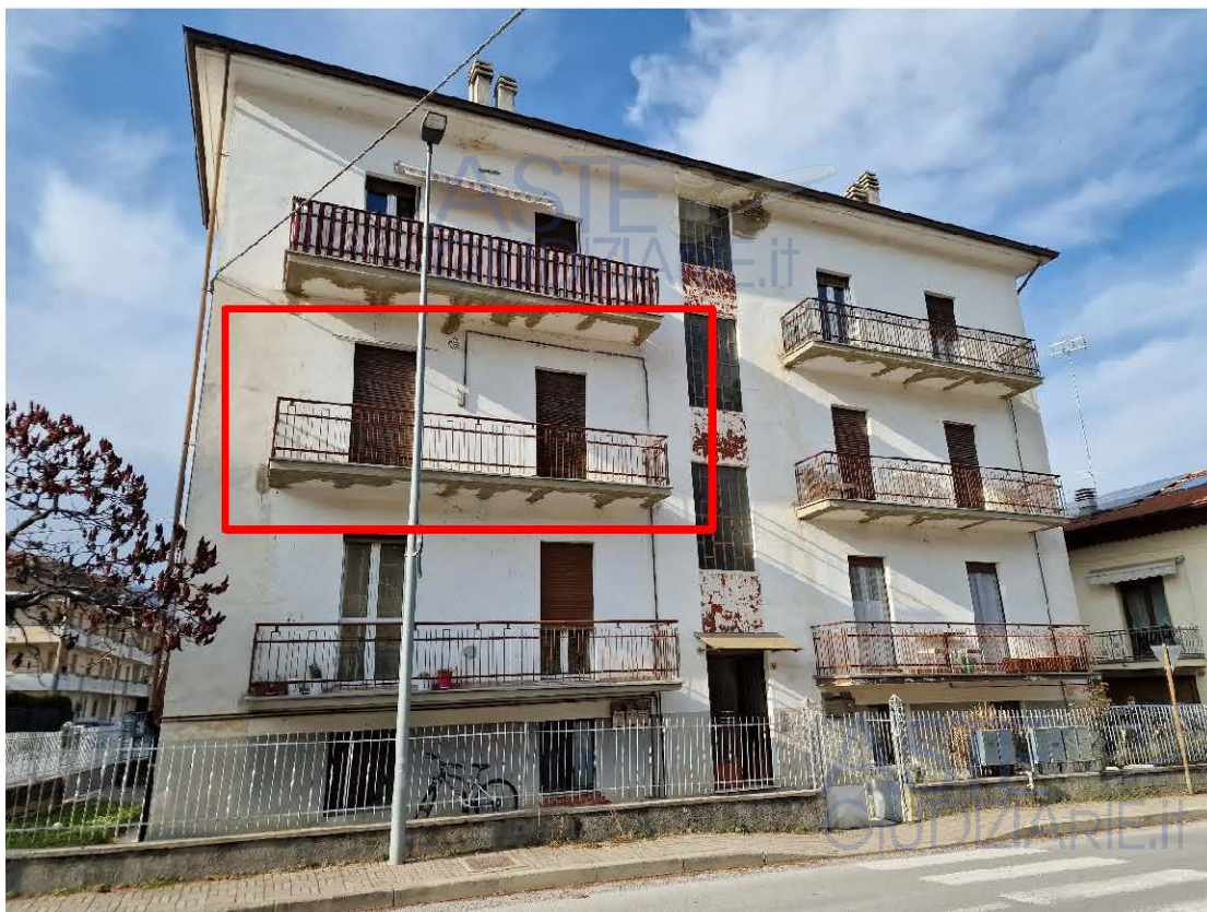
Vista prospettica esterna dell'appartamento (contorno rosso)