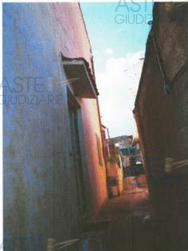
Ingresso al 1° locale di sgombero