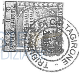
tavola N. 2.