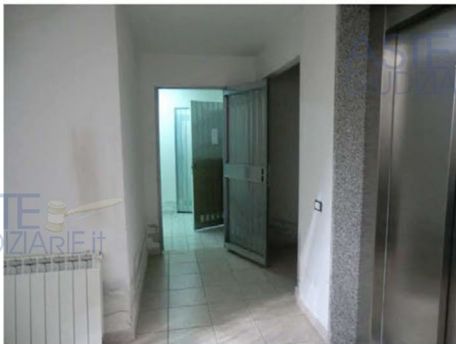
Foto n.15.Via Is Arenas n.14. Porta di accesso alla zona cantine.