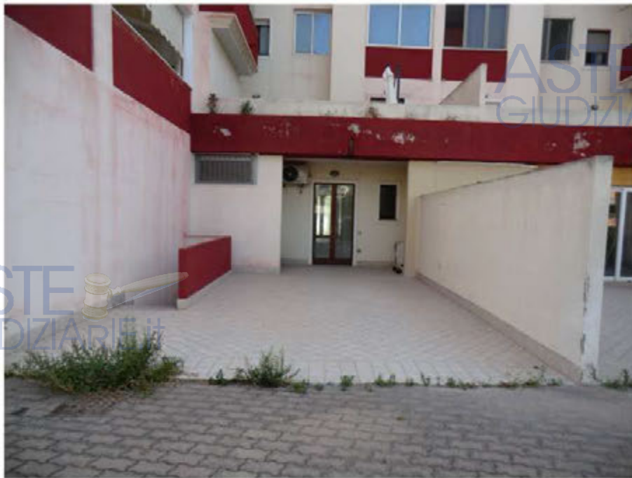
Foto n.29.Via Is Arenas n.16C . Cortile. Area urbana sub.67.