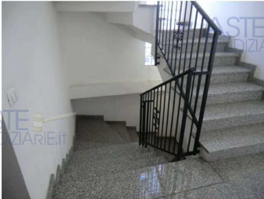
Foto n.5. Via Antonio Stradivari n.1. Scala condominiale. Rampa di accesso al piano interrato.