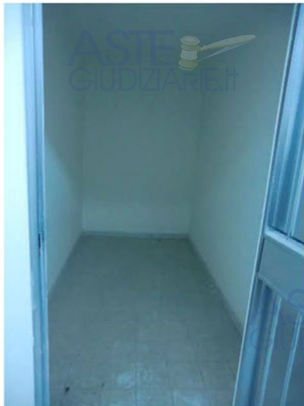
Foto n.20.Via Is Arenas n.14. Cantina sub.22.