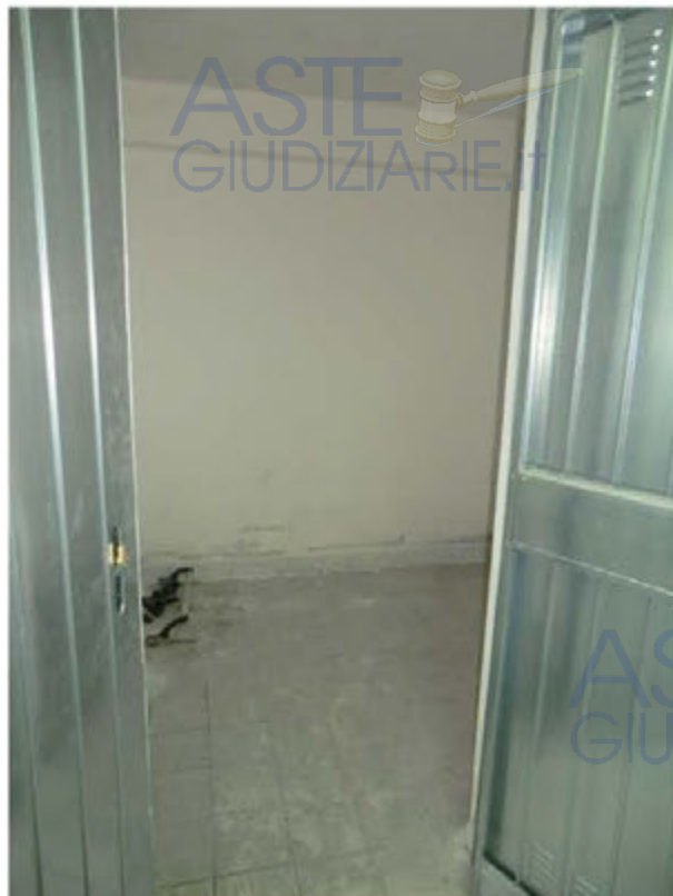
Foto n.18. Via Is Arenas n.14. Cantina sub.24. Sono visibili tracce di umidità di risalita.