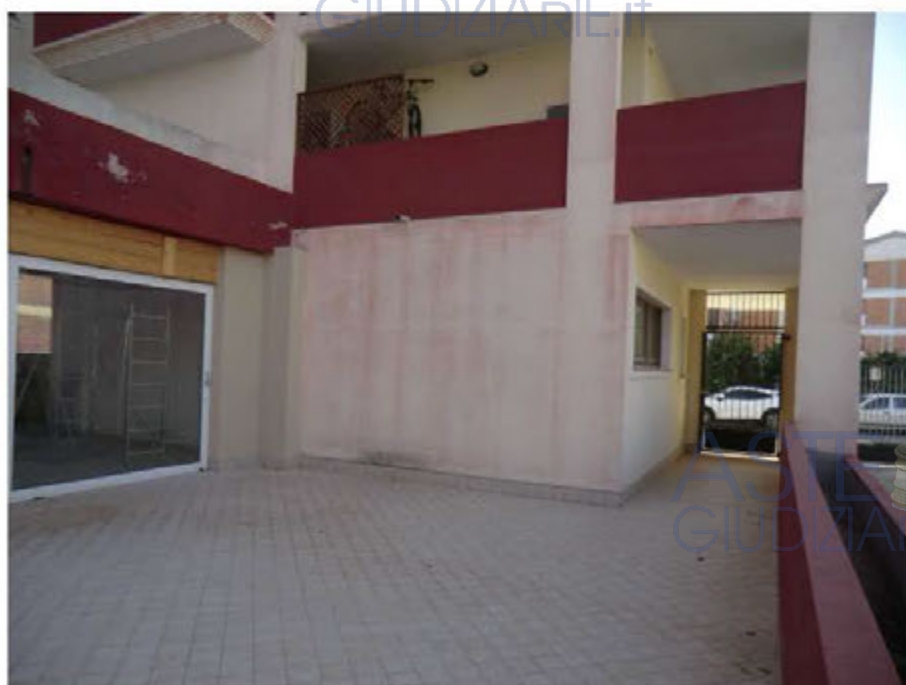
Foto n.28.Via Is Arenas n.16C . Cortile. Area urbana sub.66. E' visibile il cancello pedonale.