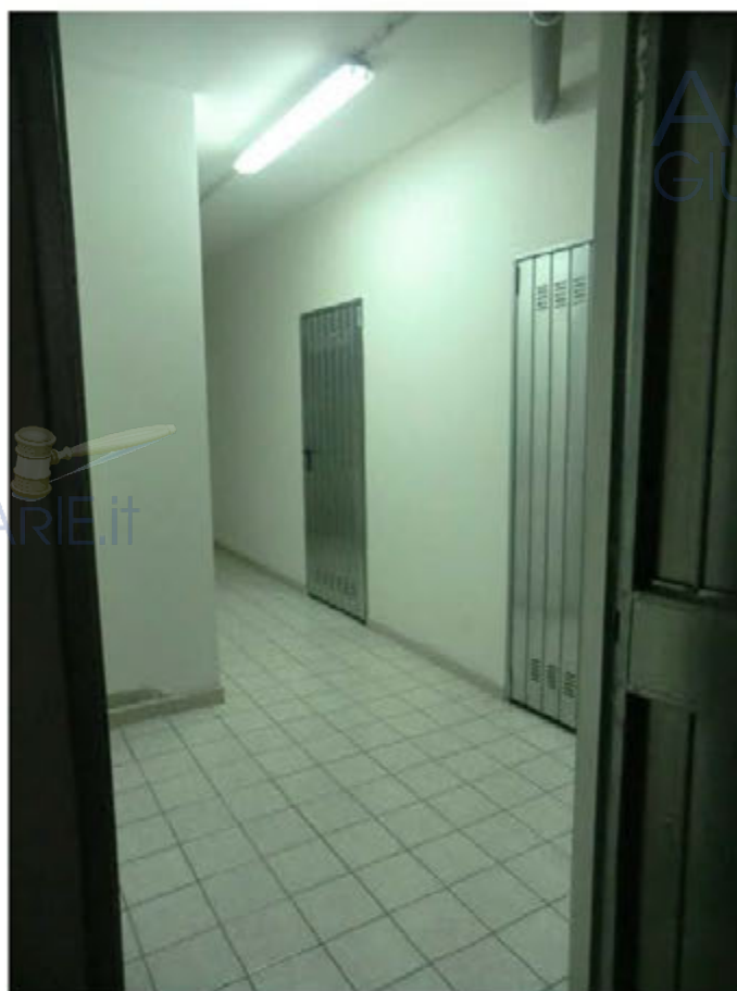
Foto n.7.Via Antonio Stradivari n.1. Disimpegno cantine.