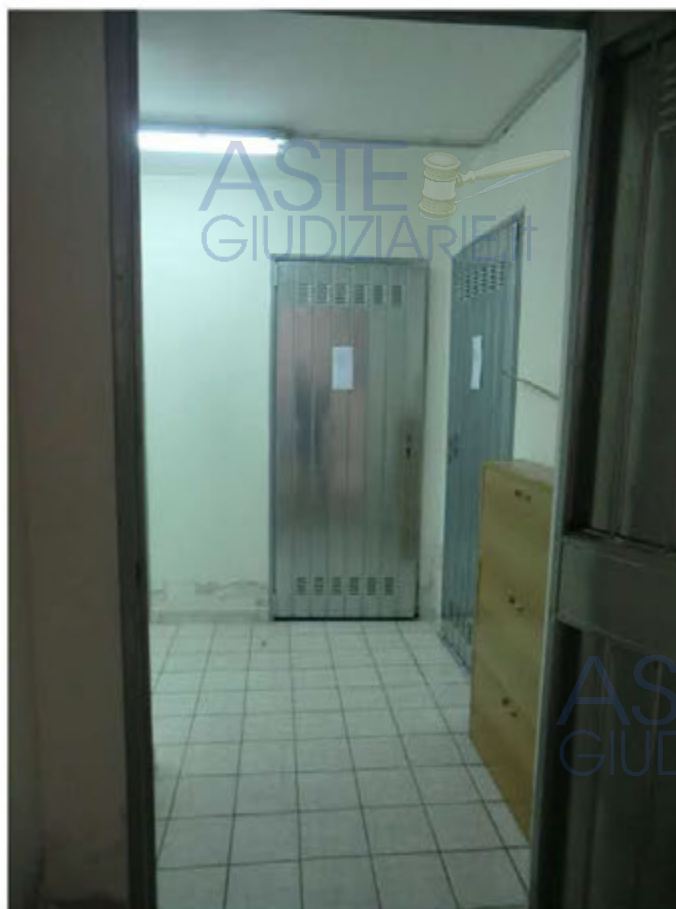
Foto n.16. Via Is Arenas n.14. Disimpegno cantine.