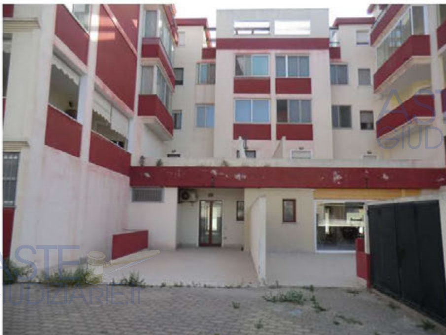
Foto n.27.Via Is Arenas n.16C . Cortile. Aree urbane sub.67 e sub.66.