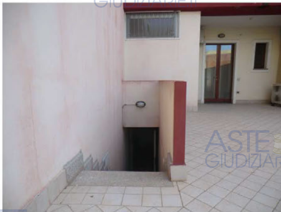
Foto n.30.Via Is Arenas n.16C.Cortile.Area urbana sub.67.Scala di accesso al piano interrato.