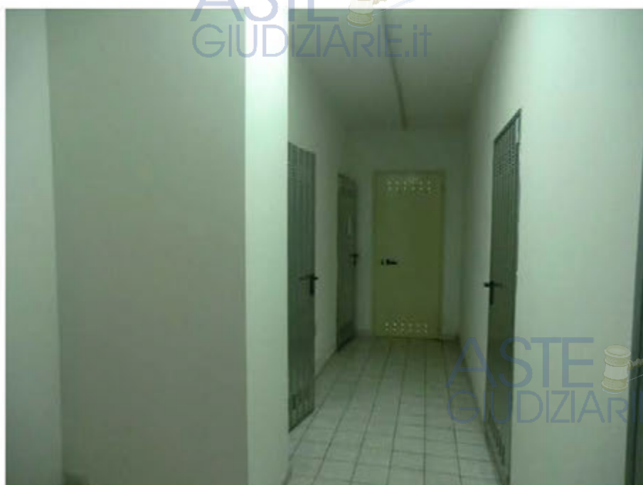
Foto n.8.Via Antonio Stradivari n.1. Disimpegno cantine. E' visibile la porta di separazione delle ultime due cantine.