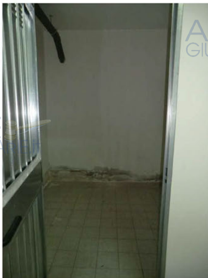
Foto n.9.Via Antonio Stradivari n.1. Cantina sub.37. Sono visibili le tracce di umidità di risalita.