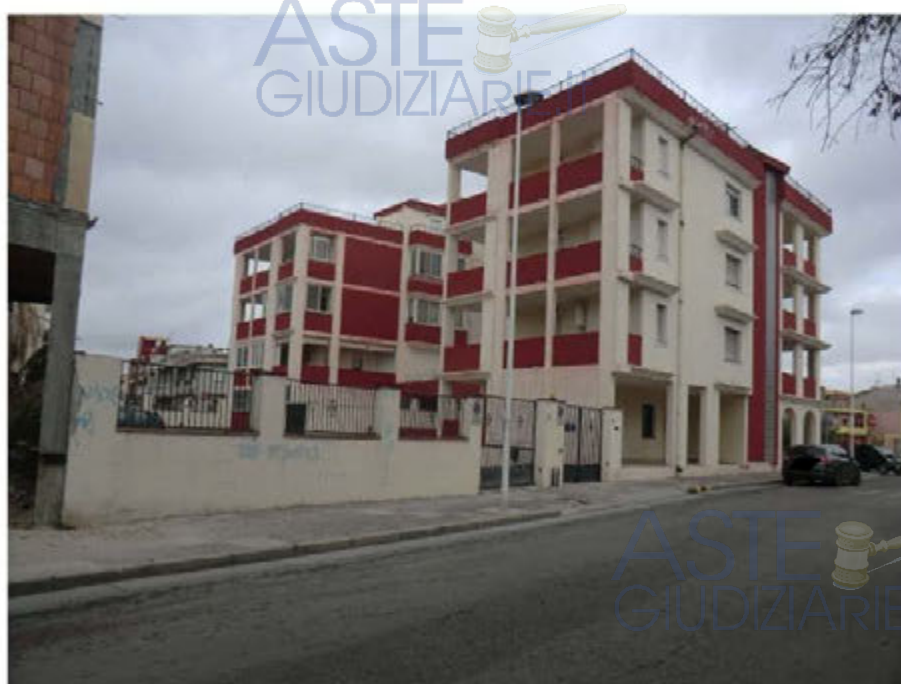
Foto n.3. Quartu S. Elena. Prospetto lato via Is Arenas. Ingresso scala (piano interrato cantine sub. 21,22,23,24 oggetto di pignoramento) e carraio (posti auto scoperti sub. 39,51,52,53 e aree urbane sub 66, 67 oggetto di pignoramento).