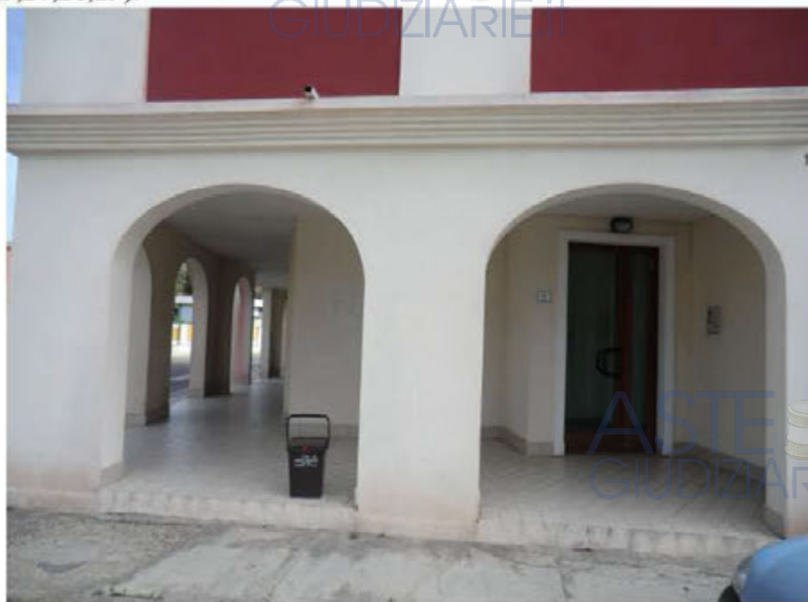
Foto n.4. Via Antonio Stradivari n.1. Ingresso condominiale (accesso alle cantine sub.31,35,36,37).

I prospetti, non di proprietà esclusiva, avrebbero necessità di manutenzione; sono visibili filature, tracce da infiltrazioni nel parapetto del lastrico solare e in particolare, sempre in corrispondenza del parapetto del lastrico solare, nei raccordi curvi dei pluviali. Le tracce da infiltrazioni sono presenti anche nella fioriera posta al primo piano lato cortile in corrispondenza delle due aree urbane. Il colore scuro della facciata è stato dilavato dall'azione della pioggia, pertanto sulle pareti della facciata sono visibili le tracce dovute al fenomeno del dilavamento (foto n.2,3,27,28,29).