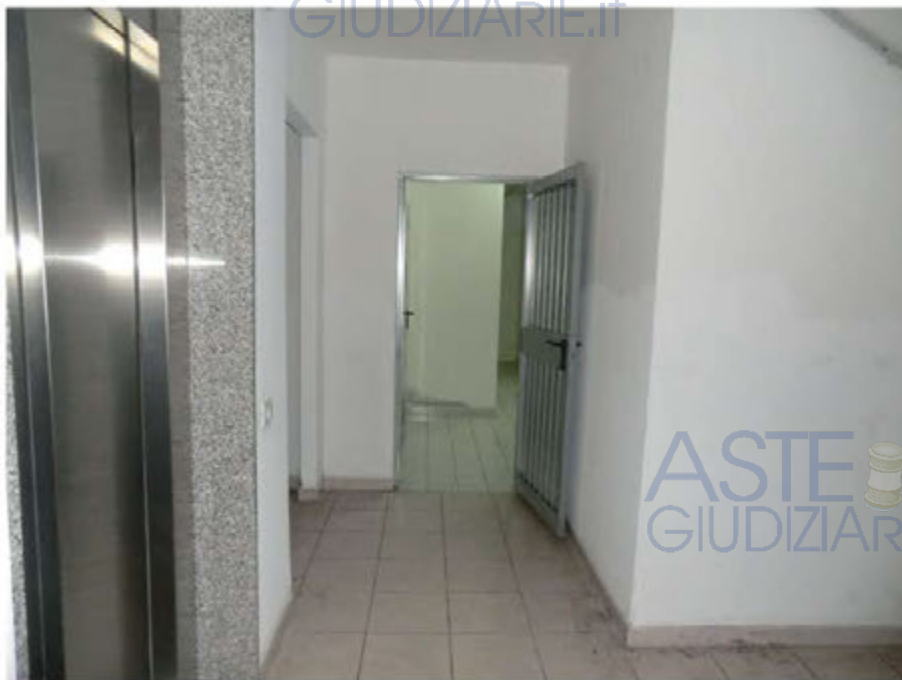
Foto n.6. Via Antonio Stradivari n.1. Porta di accesso alla zona cantine.