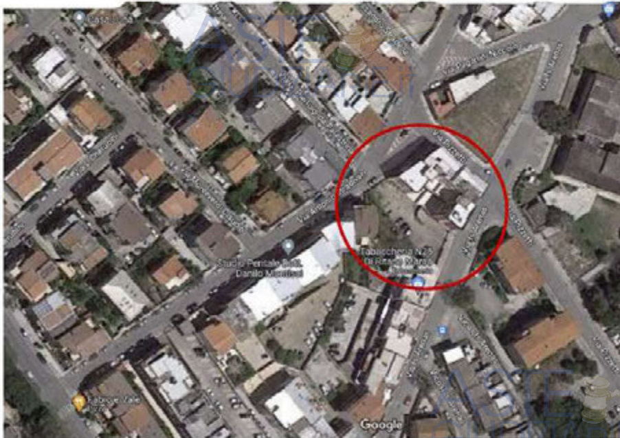
Foto n.1. Quartu S. Elena. Via Is Arenas-via Pizzetti-via A. Stradivari. Ubicazione dell'immobile (immagine tratta da Google Maps).

Gli immobili pignorati sono ubicati in un fabbricato, sito nel Comune di Quartu Sant'Elena, che si attea sulle vie Is Arenas, Antonio Stradivari e Pizzetti. Il fabbricato, a destinazione d'uso a civile abitazione e altre attività, si eleva su quattro piani fuori terra e comprende inoltre un piano interrato (cantine, box auto con accesso da rampa sulla via Is Arenas e altre attività) (Foto n.1). Il fabbricato ha due scale con accesso una dalla via Is Arenas e l'altra dalla via Antonio Stradivari e un cortile, con accesso carraio dalla via Is Arenas, con posti auto scoperti e due aree urbane (indicate nel progetto come cortile). Dalla scala di via Antonio Stradivari (Foto n. 2) si accede a quattro cantine, oggetto di pignoramento, ubicate al piano interrato. Dalla scala di via Is Arenas si accede alle altre quattro cantine, oggetto di pignoramento, ubicate al piano interrato; sempre dalla via Is Arenas si accede al cortile in cui sono ubicati i quattro posti auto scoperti oggetto di pignoramento e le due aree urbane oggetto di pignoramento (Foto n. 3).