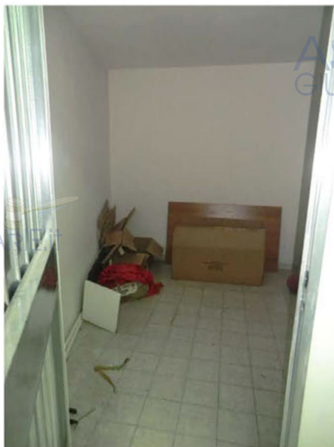
Foto n.21.Via Is Arenas n. 14. Cantina sub.21. Materiali vari depositati all'interno della cantina