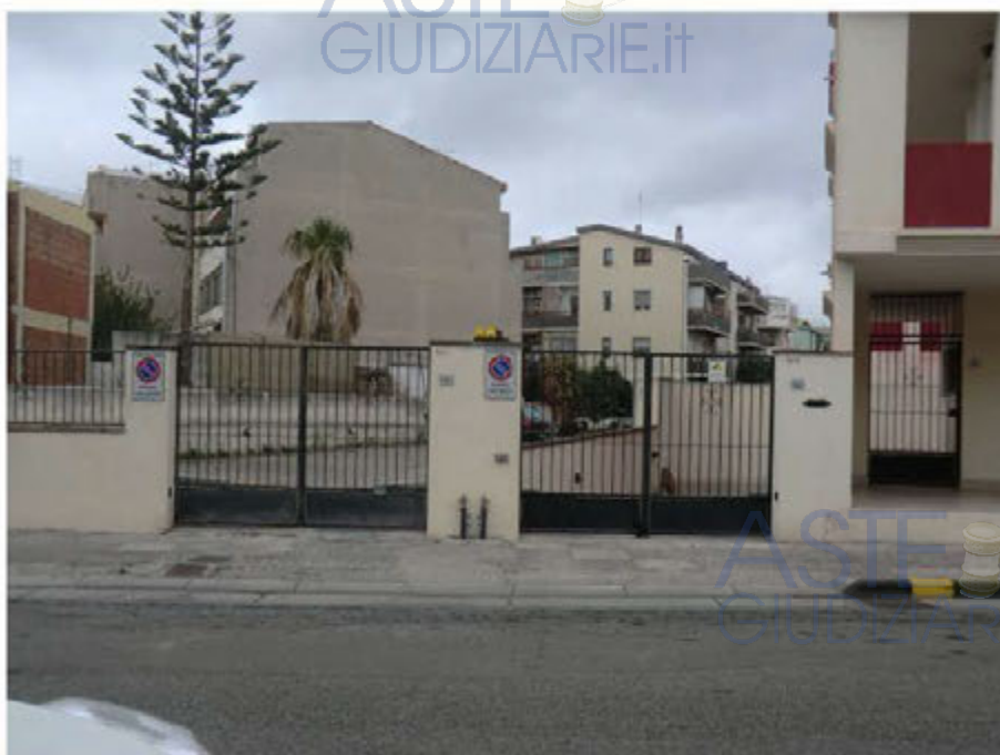
Foto n.22.Via Is Arenas n. 16C -Cancello carroia per accesso al cortile. Via Is Arenas n. 16A Cancello pedonale per accesso area urbana sub 66.