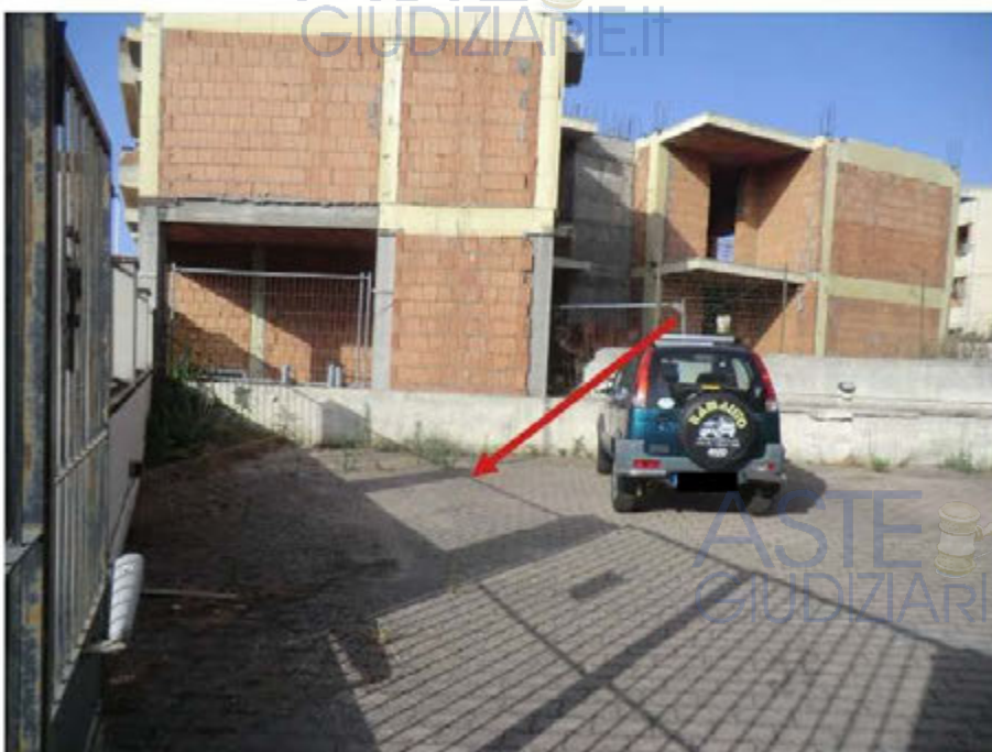
Foto n.24.Via Is Arenas n.16C . Cortile. Posto auto scoperto sub.39. La freccia indica il posto auto pignorato.