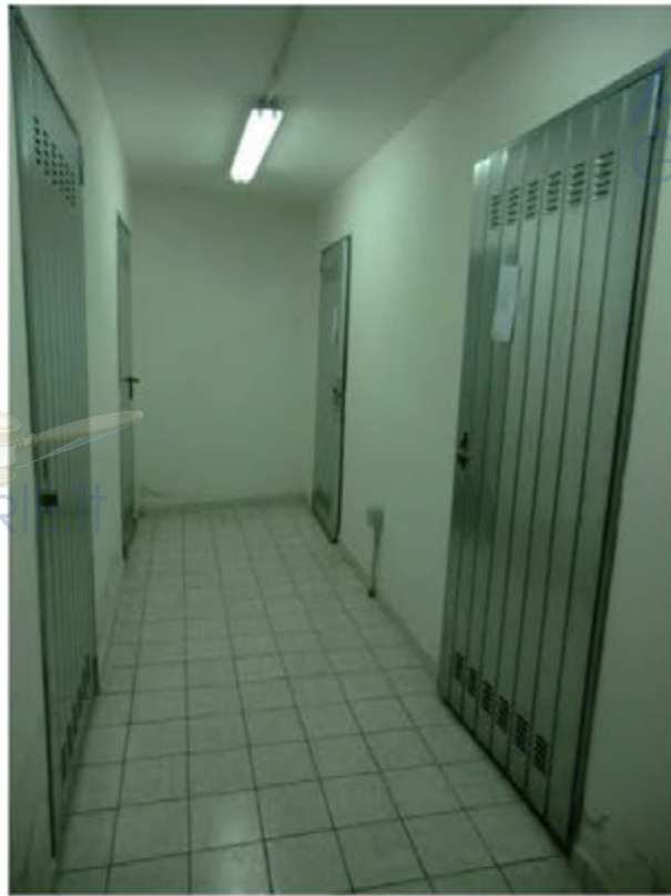
Foto n.17. Via Is Arenas n.14. Disimpegno cantine.