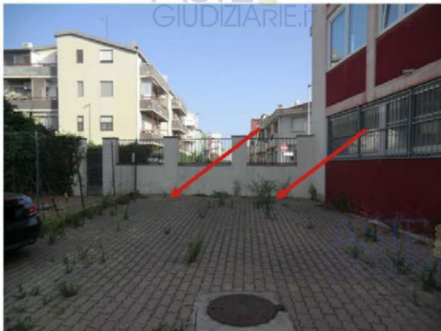
Foto n.26.Via Is Arenas n.16C . Cortile. Posto auto scoperto sub.52 e sub.53. Le frecce indicano i posti auto pignorati.