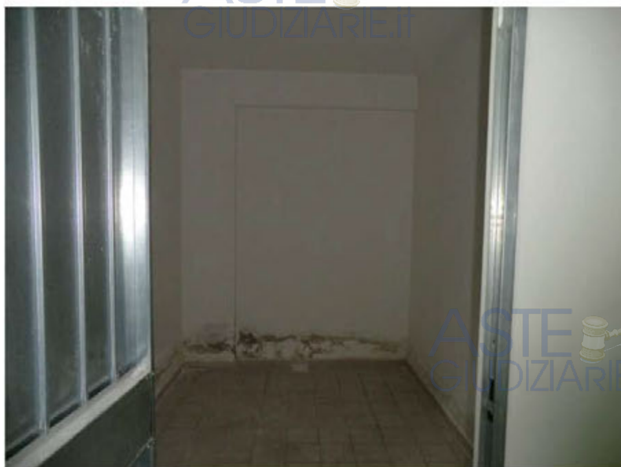
Foto n.10.Via Antonio Stradivari n.1. Cantina sub.36. Sono visibili tracce di umidità di risalita.