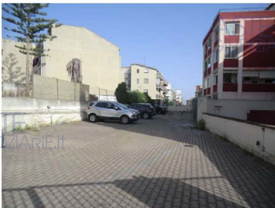
Foto n.23.Via Is Arenas n.16C . Cortile. Posti auto scoperti.