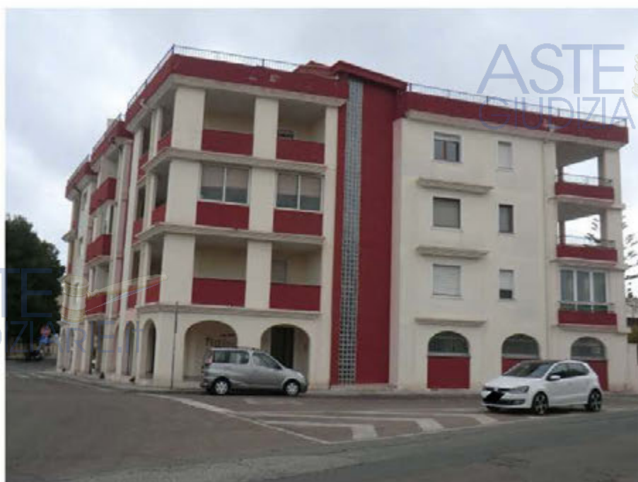
Foto n.2. Quartu S. Elena. Prospetto lato via A. Stradivari. Ingresso scala (piano interrato cantine sub. 31,35,36,37 oggetto di pignoramento).