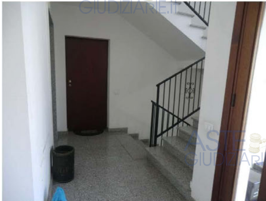
Foto n.14. Via Is Arenas n.14. Scala condominiale. Rampa di accesso al piano interrato.