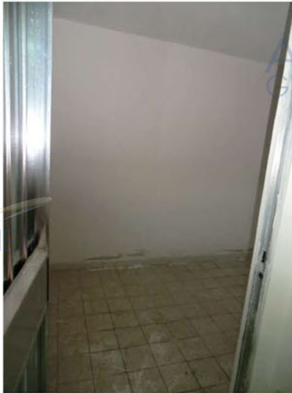
Foto n.19.Via Is Arenas n.14. Cantina sub.23. Sono visibili tracce di umidità di risalita.