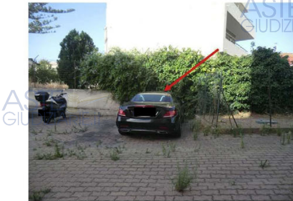
Foto n.25.Via Is Arenas n.16C . Cortile. Posto auto scoperto sub.51. La freccia indica il posto auto pignorato.