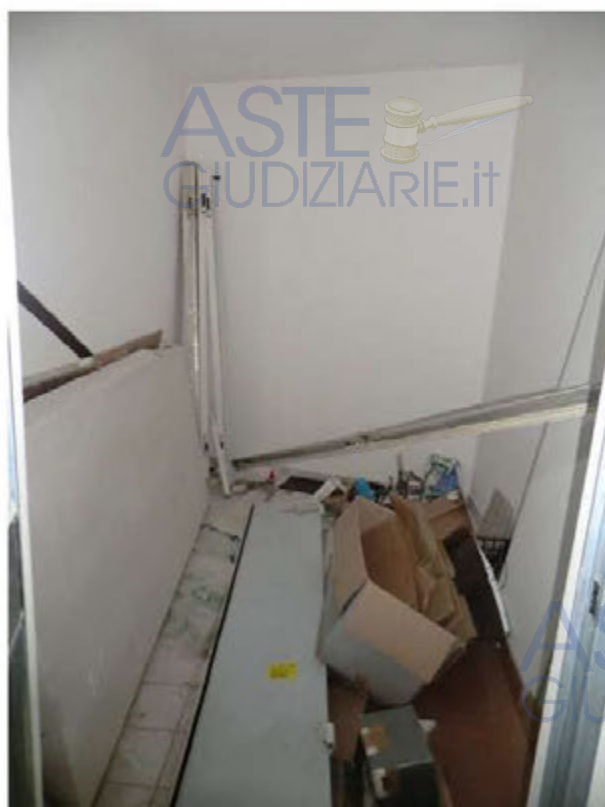
Foto n.11.Via Antonio Stradivari n.1. Cantina sub.35. Sono visibili tracce di umidità di risalita e materiali vari depositati all'interno della cantina.