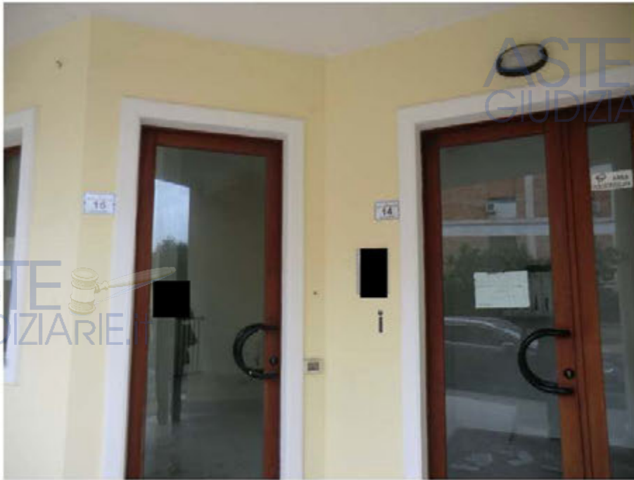
Foto n.13. Via Is Arenas n.14. Ingresso condominiale (accesso alle cantine sub.21,22,23,24).