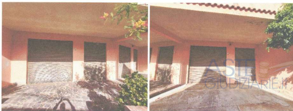
Fotografia 13 e 14: vista dall'esterno del secondo immobile e del cortile antistante

L'immobile è individuato nelle foto sottostanti e nella planimetria allegata (allegato n° 4b).