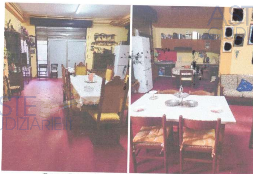
Fotografia 21 e 22: vista dell'ultimo vano adibito a cucina