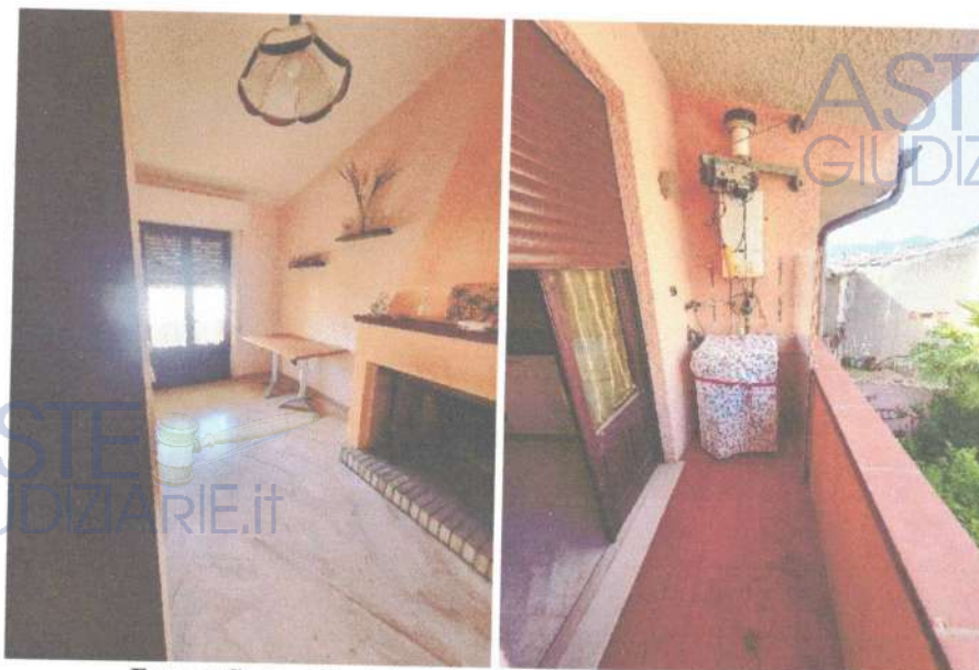
Fotografia 9 e 10: vista della cucina e del secondo terrazzino