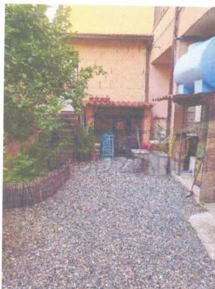
Fotografia 23: vista del cortile con, sulla sinistra, il loggiato di pertinenza

3.3 - Verifica della conformità tra la descrizione attuale del bene e quella contenuta nel pignoramento