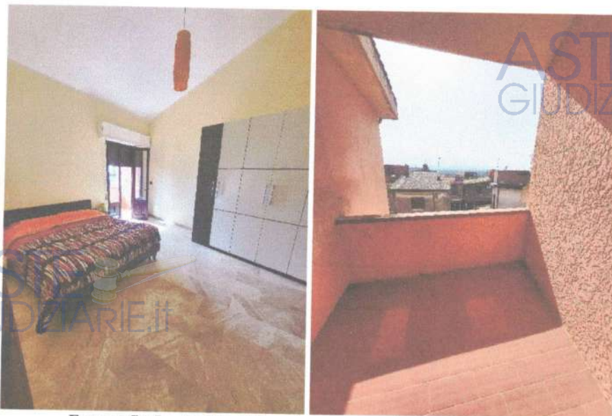
Fotografia 5 e 6: vista della prima camera da letto e del terrazzino