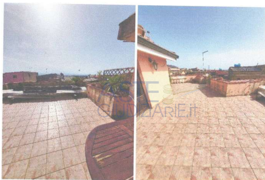
Fotografia 11 e 12: vista della terrazza del salone