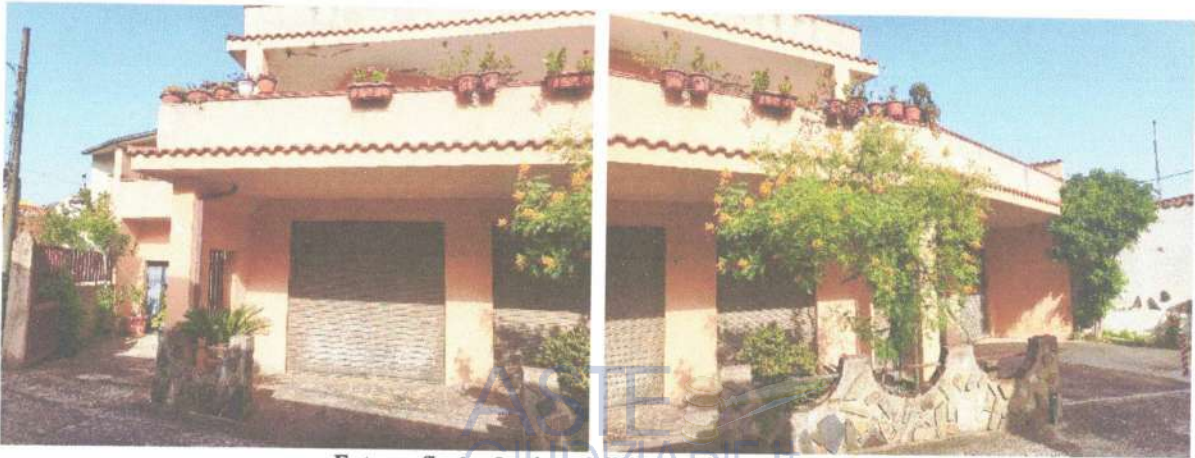
Fotografia 1 e 2: vista dell'immobile sul lato strada

L'immobile è individuato nelle foto sottostanti e nella planimetria allegata (allegato n° 4a).