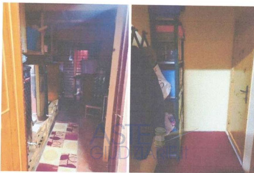
Fotografia 17 e 18: vista del piccolo vano e dell'antibagno