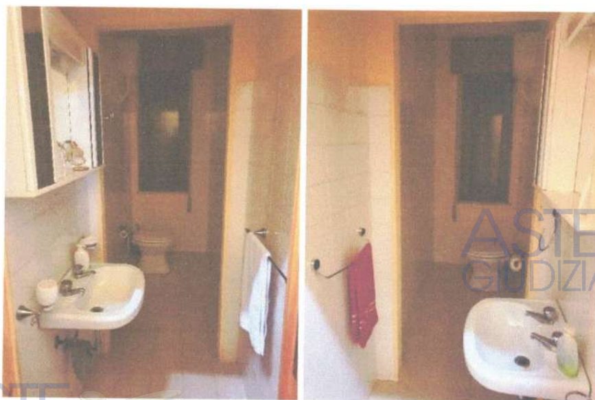
Fotografia 19 e 20: vista dei due bagni