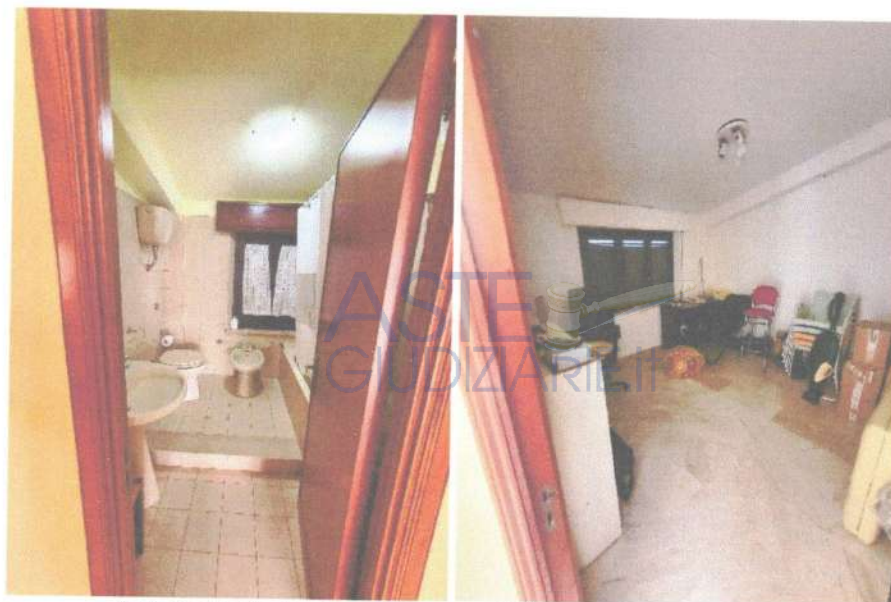
Fotografia 7 e 8: vista del bagno e della seconda camera da letto