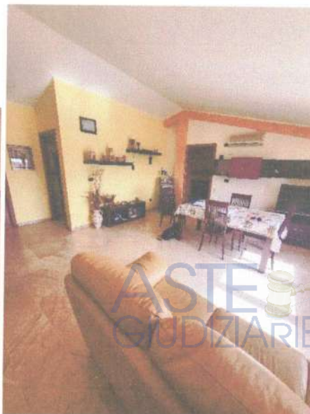
Fotografia 3 e 4: vista del portone al civico 27 e del salone dell'immobile