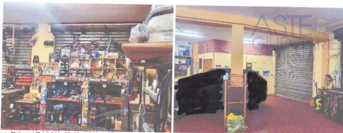
Fotografia 15 e 16: vista del grande vano principale con, sullo sfondo della seconda foto, il piccolo vano