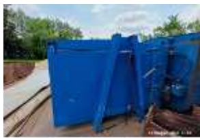
Inox Trade (50)