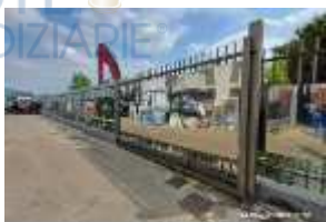
Inox Trade (59)