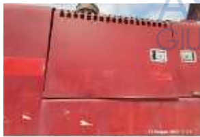
Inox Trade (3)