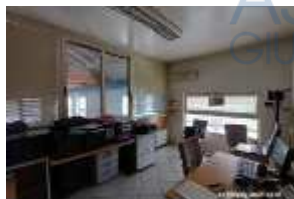
Inox Trade (83)