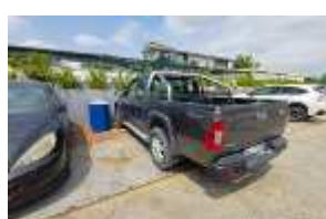
Inox Trade (101)