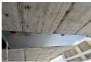
Inox Trade (15)