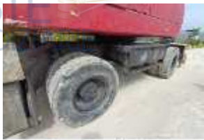
Inox Trade (4)