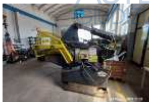
Inox Trade (62)