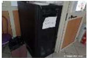
Inox Trade (76)