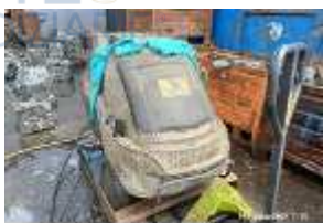
Inox Trade (34)