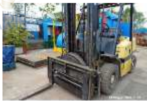
Inox Trade (18)