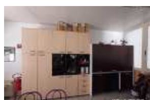
Inox Trade (97)