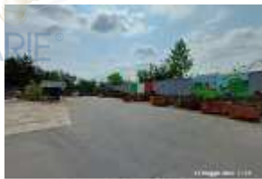
Inox Trade (8)