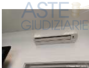
Inox Trade (108)