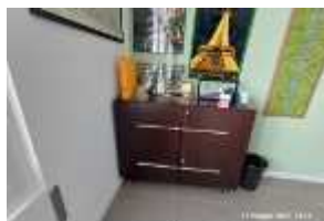
Inox Trade (113)