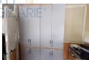
Inox Trade (96)