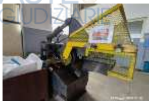
Inox Trade (65)