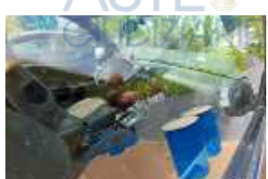
Inox Trade (103)