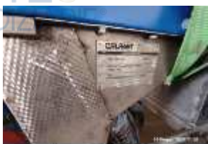
Inox Trade (69)