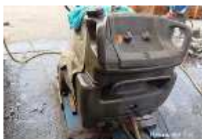
Inox Trade (35)