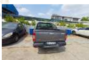
Inox Trade (100)