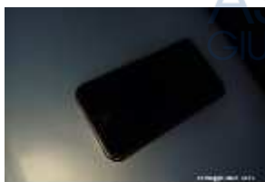
Inox Trade (120)