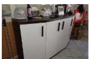
Inox Trade (98)