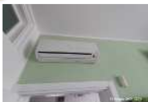
Inox Trade (109)