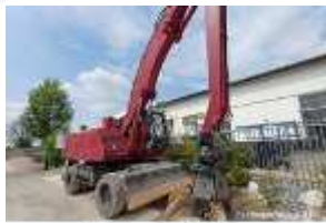
Inox Trade (2)