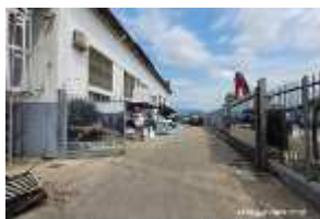
Inox Trade (57)