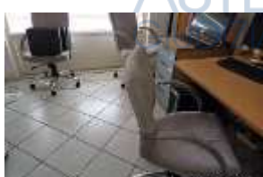
Inox Trade (99)