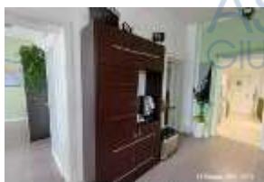
Inox Trade (110)