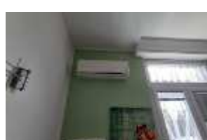
Inox Trade (107)