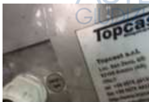
Inox Trade (27)