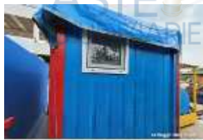
Inox Trade (11)