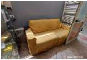
Inox Trade (72)