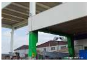
Inox Trade (47)