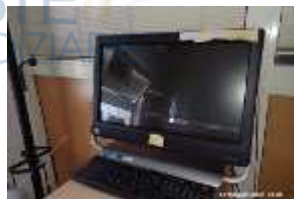
Inox Trade (86)