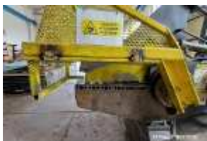
Inox Trade (64)