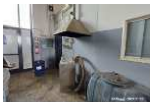
Inox Trade (25)