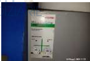
Inox Trade (24)