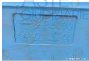
Inox Trade (46)