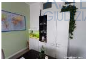
Inox Trade (114)