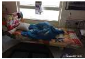
Inox Trade (75)