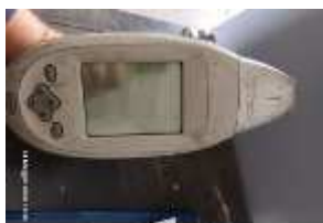
Inox Trade (32)