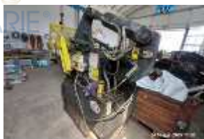
Inox Trade (63)