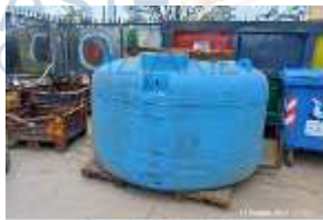
Inox Trade (45)