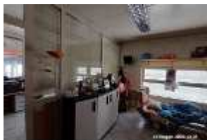
Inox Trade (82)