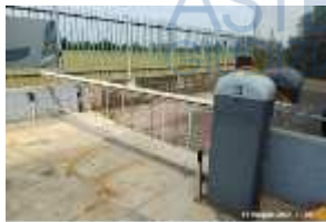
Inox Trade (42)