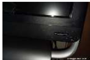
Inox Trade (87)