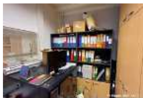
Inox Trade (116)