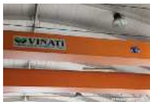
Inox Trade (61)