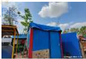
Inox Trade (53)