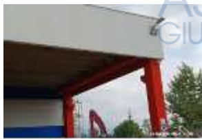
Inox Trade (48)