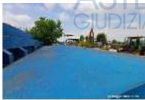
Inox Trade (52)