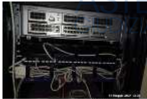
Inox Trade (77)