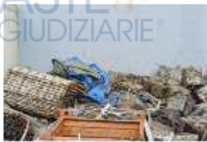
Inox Trade (55)