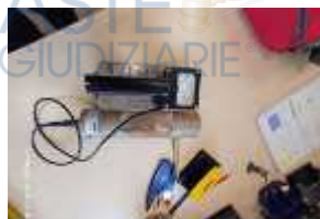
Inox Trade (117)