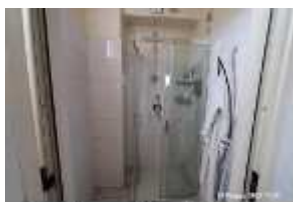
Inox Trade (70)