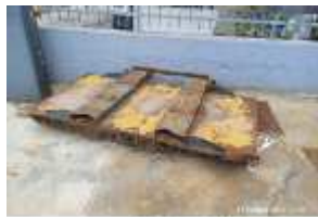
Inox Trade (41)