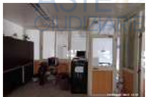
Inox Trade (81)