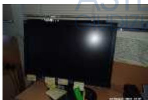
Inox Trade (89)