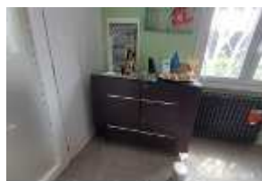
Inox Trade (112)