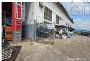
Inox Trade (58)