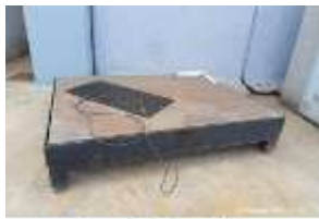
Inox Trade (40)