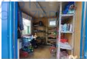
Inox Trade (10)