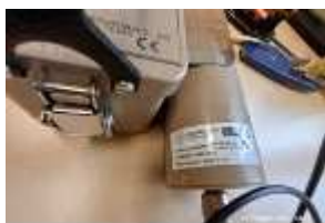
Inox Trade (119)