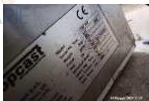
Inox Trade (28)