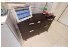
Inox Trade (115)