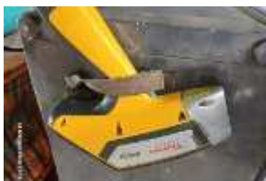
Inox Trade (29)