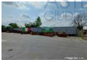
Inox Trade (7)