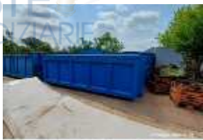
Inox Trade (49)