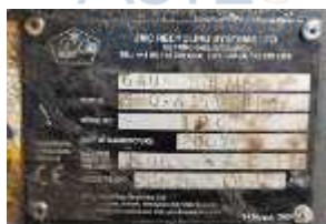
Inox Trade (66)