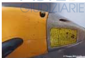
Inox Trade (31)