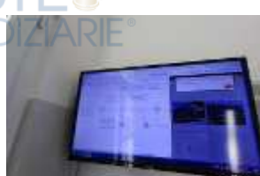
Inox Trade (106)