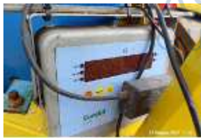
Inox Trade (38)