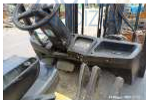
Inox Trade (21)