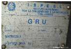
Inox Trade (6)