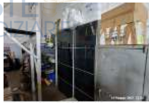
Inox Trade (74)