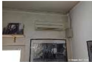
Inox Trade (79)