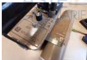
Inox Trade (118)