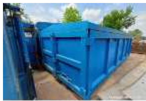
Inox Trade (51)