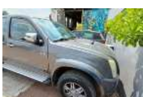
Inox Trade (104)