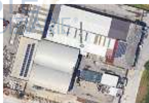
Inox Trade (121)