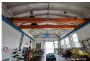
Inox Trade (60)