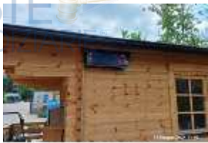
Inox Trade (39)