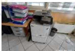
Inox Trade (90)