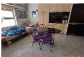
Inox Trade (94)