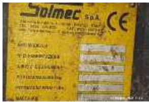
Inox Trade (5)