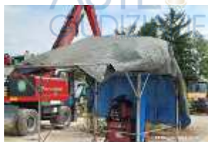
Inox Trade (56)