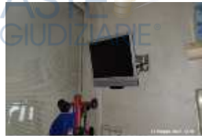
Inox Trade (80)