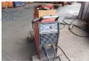
Inox Trade (43)