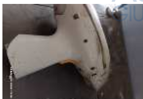
Inox Trade (33)