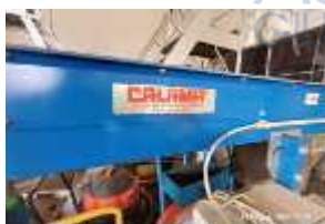
Inox Trade (68)