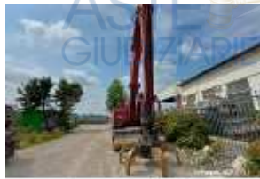
Inox Trade (1)