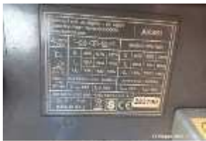
Inox Trade (44)