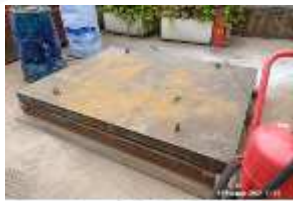
Inox Trade (37)