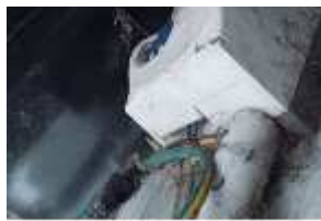
Inox Trade (16)