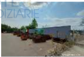
Inox Trade (14)