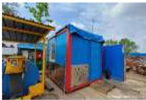
Inox Trade (9)