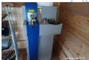
Inox Trade (23)