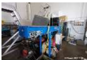
Inox Trade (67)