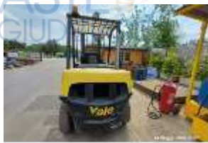
Inox Trade (20)