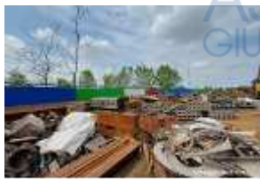
Inox Trade (13)