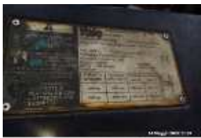
Inox Trade (19)