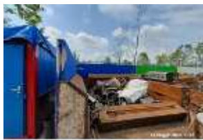
Inox Trade (12)