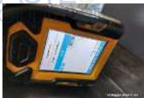
Inox Trade (30)