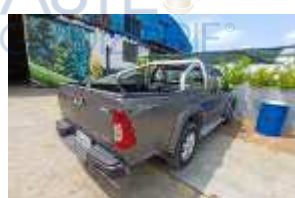
Inox Trade (102)