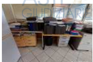
Inox Trade (93)