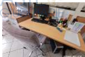
Inox Trade (92)