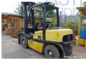
Inox Trade (17)