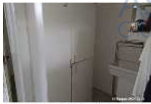
Inox Trade (73)