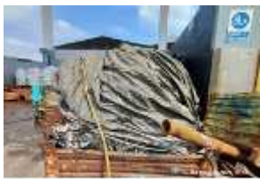
Inox Trade (54)