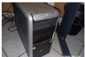
Inox Trade (88)