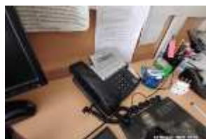
Inox Trade (91)