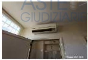
Inox Trade (71)