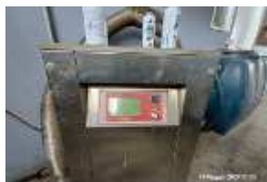
Inox Trade (26)