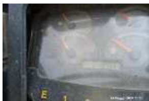
Inox Trade (22)