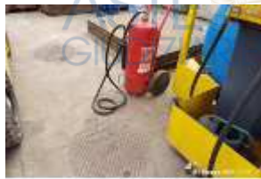
Inox Trade (36)