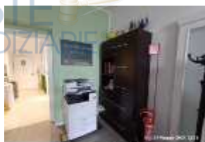
Inox Trade (111)