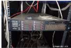
Inox Trade (78)