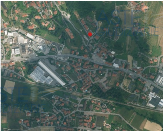
PONTIDA VIA CARDUCCI 55/A