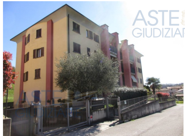
PONTIDA VIA CARDUCCI 55/A