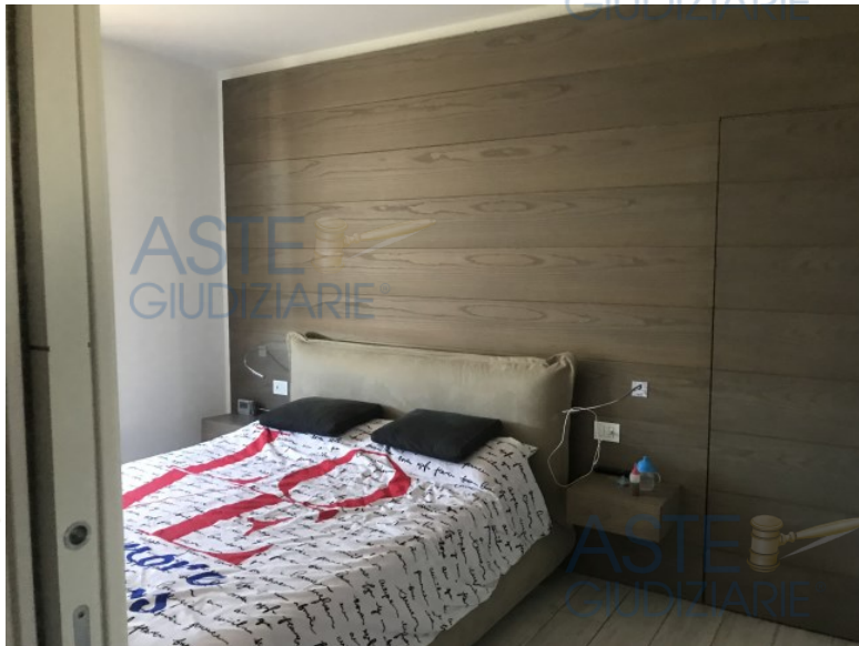
camera da letto